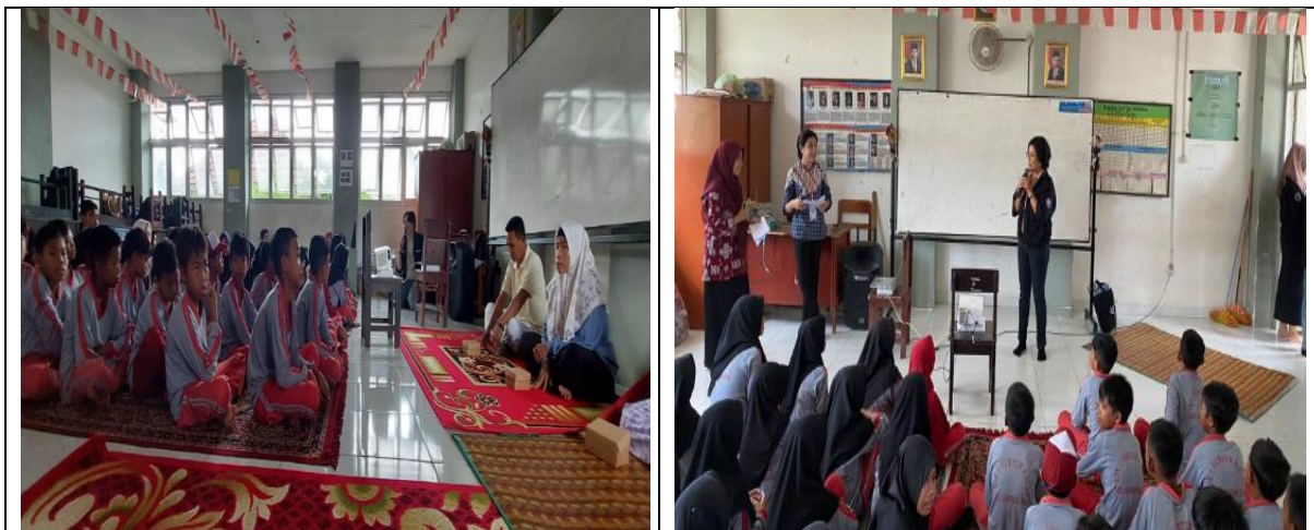
Gambar 3. Sosialisasi di damping Guru dan Mahasiswa

Kegiatan sosialisasi diawali dengan sambutan dari ibu kepala sekolah dan kemudian dilanjutkan pemaparan secara interaktif dari tim pengabdian. Pemaparan ini disampaikan dengan cara dan bahasa yang lebih mudah dimengerti anak-anak sekolah dasar. Materi yang pertama di jelaskan adalah mengenai tabungan, jenis-jenis bank yang ada di Indonesia, video animasi tentang menabung, serta cara nabung menggunakan target.