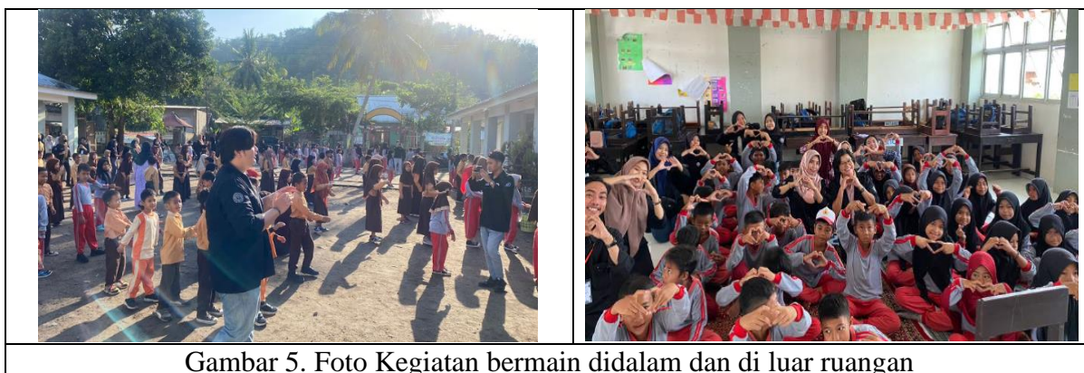
Gambar 5. Foto Kegiatan bermain didalam dan di luar ruangan

Sepanjang penyampaian materi para siswa juga di ajak berdiskusi, bermain game sehingga mereka menjadi lebih antusias dalam mengikuti sosialisasi yang dilakukan. Keterlibatan mahasiswa dalam kegiatan ini sangat penting terutama dalam mengajak para siswa bermain, mendampingi para siswa ketika para pengabdian dalam menyampaikan materi membantu koordinasi ketika dilakukan permainan dan membuat suasana menjadi lebih meriah. Sebagai Generasi Z para mahasiswa sangat kreatif dalam memadukan apa yang lagi trend di sosial media dengan tema materi sosialisasi sehingga membuat materi sosialisasi menjadi lebih berwarna. Para mahasiswa/i sangat antusias dalam mengikuti kegiatan dan semangat dalam menyampaikan materi kepada adik-adik siswa sekolah dasar yang menjadi peserta. Hal ini menjadi bekal berharga bagi mahasiswa yang merupakan bagian dari service learning dalam membuka wawasan mahasiswa untuk melihat realita kehidupan Masyarakat (linawati, 2015)