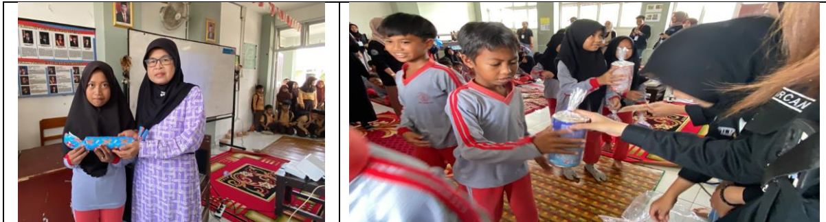
Gambar 6. Pembagian Hadiah dan Cenderamata