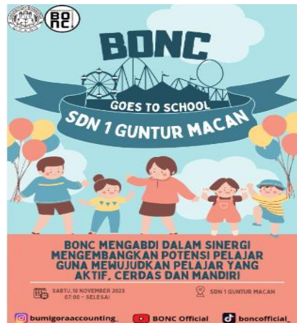
Gambar 2. Poster Kegiatan

18 November 2023. Pada tahap awal Para mahasiswa melakukan kordinasi rencana kegiatan dengan pihak mitra yaitu pihak sekolah untuk menentukan kapan tepatnya kami dapat berkunjung dalam rangka memberikan sosialisasi dan berapa jumlah peserta yang terlibat.