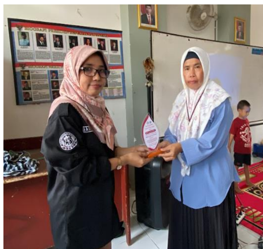
Gambar 8. Penyerahaan Plakat

Setelah sesi pembagian celengan dan hadiah selsai dilaksanakan, kemudian siswa/i tersebut kembali ke kelas masing-masing dan bersiap-siap untuk pulang. Setelah sesi foto bersama sebagai penutup kegiatan, ketua tim pengabdian juga memberikan sertifikat dan cendramata berupa plakat Bumigora kepada pihak sekolah SDN 1 Guntur Macan yang diwakili oleh ibu wakil kepala sekolah. Sertifikat dan plakat tersebut sebagai bentuk apresiasi kepada SDN 1 Guntur Macan karena berpartisipasi dalam kegiatan sosialisasi yang dilaksanakan oleh tim Pengabdian Universitas Bumigora.