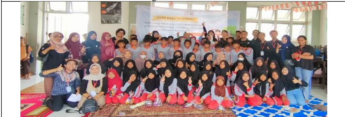
Gambar 7. Peserta Sosialisasi

Setelah sesi pembagian celengan dan hadiah selsai dilaksanakan, kemudian siswa/i tersebut kembali ke kelas masing-masing dan bersiap-siap untuk pulang. Setelah sesi foto bersama sebagai penutup kegiatan, ketua tim pengabdian juga memberikan sertifikat dan cendramata berupa plakat Bumigora kepada pihak sekolah SDN 1 Guntur Macan yang diwakili oleh ibu wakil kepala sekolah. Sertifikat dan plakat tersebut sebagai bentuk apresiasi kepada SDN 1 Guntur Macan karena berpartisipasi dalam kegiatan sosialisasi yang dilaksanakan oleh tim Pengabdian Universitas Bumigora.