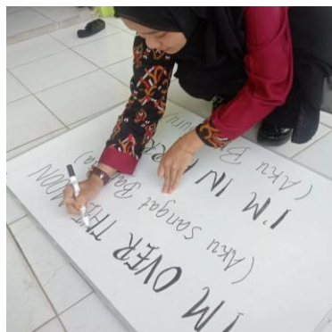
Gambar 2. Anggota tim pengabdian menulis frasa baru di papan tulis sebelum disampaikan kepada siswa

Tahapan ketiga adalah memperkenalkan frasa baru dengan menggunakan media papan tulis ini membantu siswa memvisualisasikan konsep yang diajarkan, sehingga lebih mudah dipahami, di mana frasa tersebut telah ditulis sebelumnya oleh salah satu anggota tim pengabdian. Setelah diperkenalkan, siswa diajak untuk memahami makna dan cara penggunaan frasa tersebut dalam kalimat sehari-hari, sehingga mereka semakin terbiasa dan percaya diri dalam berbahasa Inggris.