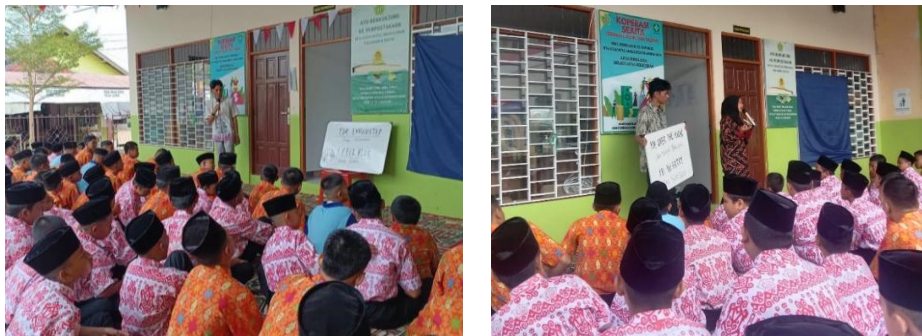
Gambar 3. Tim pengabdian memandu siswa dalam mengucapkan frasa baru secara bersama-sama

Setelah penyampaian frasa oleh tim pengabdian, sebagai bentuk evaluasi, beberapa siswa diminta untuk maju ke depan kelas dan memimpin teman-temannya dalam mengucapkan kembali frasa tersebut. Kegiatan ini bertujuan untuk menilai sejauh mana siswa memahami dan mengingat frasa yang telah diajarkan, sekaligus melatih kepercayaan diri mereka dalam berbicara bahasa Inggris di depan umum. Dengan tampil di depan teman-teman, siswa tidak hanya belajar mengucapkan bahasa Inggris dengan benar, tetapi juga mengembangkan keterampilan komunikasi dan keberanian tampil di hadapan orang lain, yang merupakan bekal penting dalam pembelajaran bahasa dan keterampilan sosial mereka.