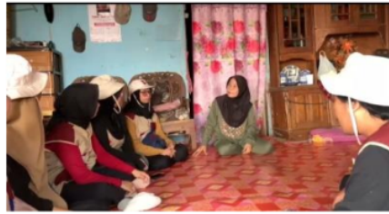
Gambar 3. Sosialisasi dengan pelaku usaha ikan asin

Kegiatan sosialisasi diselenggarakan oleh kelompok pengabdian masyarakat ke rumah-rumah produksi yang tergabung dalam satu kelompok penggiat usaha iwak asin Palembang (SIABANG), kegiatan ini berlangsung selama satu bulan dan lokasi kegiatan ini berada di Kelurahan Lima Ulu yang merupakan salah satu kawasan pemukiman padat penduduk di kota Palembang. Adapun kegiatan ini berupa pelatihan dan cara pengemasan produk. kegiatan ini dilakukan di ruang pertemuan Kantor Camat Seberangan Ulu 1 dan dikediaman salah satu mitra pengabdian masyarakat dikampung sentra iwak asin Palembang. Umumnya pelaku usaha antusias dengan kegiatan ini karena ingin memperoleh pengetahuan pengemasan produk dan pengetahuan pemasaran ke dunia online. Setelah memperoleh pengetahuan pihak pelaku usaha berupaya memperbaiki cara pengemasan produk dan mengembangkan produk iwak asin melalui packaging yang menarik dan bervariasi untuk dijual ke pasaran. Mengingat produksi dari pembuatan iwak asin ini tidak memakai bahan pengawet.