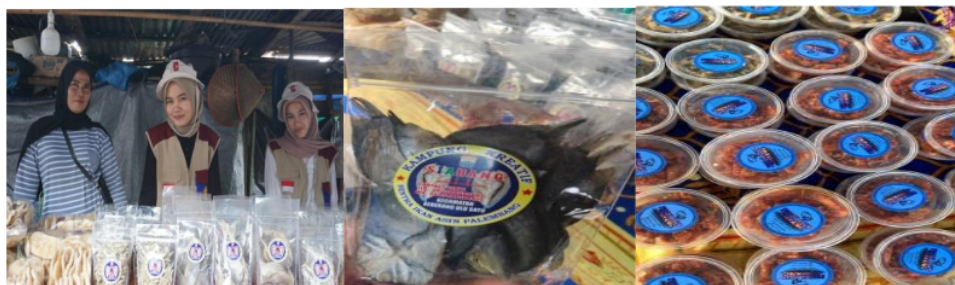
Gambar 5: Proses kegiatan pemberdayaan usaha ikan asin

Hasil dari pelatihan, pelaku usaha telah mampu merubah cara memproduksi packaging dengan dua varian berupa produk sambal iwak asin yang siap dimakan dan kemasan packaging iwak asin kering dalam bentuk kemasan 500 gram. Selain dari itu mereka juga mampu memasarkan iwak asin melalui Instagram, facebook, dan Tiktok. Menurut Nasib (2024), Ikan asin dinilai memiliki nilai ekonomis lebih dibandingkan dengan ikan asin yang dipasarkan tanpa adanya kemasan yang inovatif. Menurut Anjarsari (2024), menerangkan bahwa Inovasi kemasan produk merupakan strategi yang efektif dalam pemberdayaan UMKM. Dengan kemasan yang inovatif, UMKM dapat meningkatkan nilai tambah produk, memperluas akses pasar, meningkatkan kepercayaan konsumen, dan mendukung keberlanjutan lingkungan.