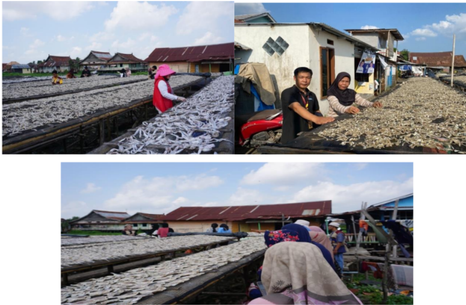
Gambar 1. Dokumentasi : 1. Ikan Asin yang dikeringkan