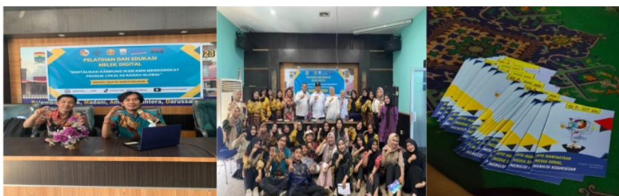
Gambar 4. Pelatihan digitalisasi bagi pelaku usaha ikan Asin

Melalui kegiatan pelatihan digitalisasi bagi pelaku usaha UKM ikan asin terdapat perkembangan yang baik, mereka mulai tertarik untuk memasarkan produk. Menurut Khabibah (2022:1050) pemanfaatan digital marketing memberikan dampak baik dan dapat meningkatkan penjualan dari produk yang mereka buat. Dengan adanya manfaat yang dihasilkan, pelaku UMKM tertarik untuk memasarkan produk mereka lewat media sosial guna mengenalkan produk dan informasi tentang bisnis yang sedang dijalaninya. Media sosial yang digunakan seperti Instagram, Facebook, Tiktok, bahkan beberapa pelaku UMKM menggunakan media Youtube untuk lebih mengenalkan informasi produknya secara detail.