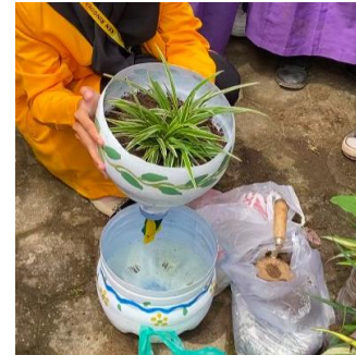
Gambar 7. Pemberian Air Nutrisi AB Mix

Tanaman yang dipilih untuk ditanam dalam pot hidroponik ini adalah Tanaman Obat Keluarga (TOGA), yang memiliki berbagai manfaat baik untuk kesehatan maupun lingkungan. TOGA dipilih karena mudah ditanam, memiliki daya tahan tinggi, serta dapat tumbuh dengan baik dalam sistem hidroponik tanpa perawatan yang rumit. Tanaman ini juga berfungsi sebagai media belajar bagi siswa untuk mengenal berbagai jenis tanaman obat serta memahami manfaatnya dalam kehidupan sehari-hari. Dengan menanam TOGA, siswa tidak hanya mempelajari teknik hidroponik, tetapi juga memperoleh wawasan tentang pemanfaatan tanaman herbal sebagai alternatif obat alami. Pemilihan TOGA diharapkan dapat meningkatkan kesadaran siswa akan pentingnya tanaman obat serta mendorong mereka untuk lebih peduli terhadap lingkungan dan kesehatan.