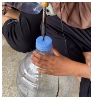
Gambar 2. Memberikan Lubang Pori

Setelah galon diberi lubang sumbu dan lubang pori, langkah selanjutnya adalah pengecatan pada badan galon pot hidroponik. Pengecatan ini bertujuan untuk mencegah pertumbuhan lumut serta memberikan kesan estetika pada pot tersebut. Setelah cat mengering, kain flanel dipasang pada lubang sumbu yang telah disiapkan sebelumnya. Kain flanel ini berfungsi sebagai media perantara yang membantu menyalurkan nutrisi dari larutan di bagian bawah pot ke akar tanaman.