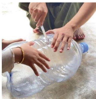
Gambar 1. Pemotongan Galon

Pelaksanaan pembuatan pot hidroponik dimulai dengan memastikan bahwa botol dan galon bekas dalam kondisi bersih, tidak kotor, lecek, atau kusam. Selanjutnya, badan galon dipotong menjadi dua bagian menggunakan gunting/kater/pisau, kemudian pada galon bagian atas dan tutup galon dibuat beberapa lubang pori menggunakan solder. Lubang pada galon bagian atas berfungsi sebagai jalur akar tanaman serta mencegah kejenuhan air di dalam pot sedangkan lubang pada tutup galon berfungsi sebagai tempat sumbu dan jalan masuk air.