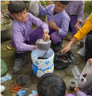
Gambar 5. Pemberian Media Tanam

Langkah selanjutnya dalam pembuatan pot hidroponik adalah pemberian pupuk atau media tanam siap pakai ke dalam pot yang telah disiapkan. Setelah media tanam dimasukkan, proses dilanjutkan dengan penanaman tanaman agar dapat tumbuh dengan baik dalam sistem hidroponik. Kemudian, potongan bagian bawah pot diisi dengan air yang telah dicampur larutan AB Mix untuk memenuhi kebutuhan nutrisi tanaman dan menjaga kesuburan media tanam.