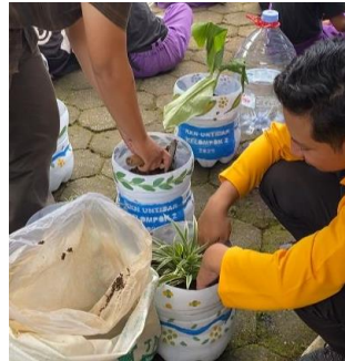
Gambar 6. Penanaman Tanaman Obat Keluarga