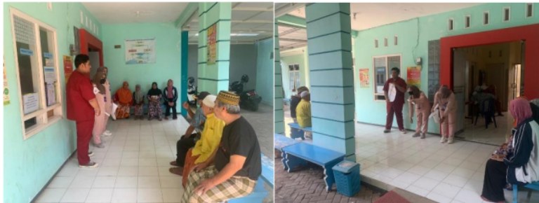
Gambar 2 Penyuluhan tentang frozen shoulder dan penanganannya

Kegiatan penyuluhan terkait frozen shoulder pada kelompok lansia di Pustu Kelurahan Buring, Kedungkandang berjalan dengan baik dan lancar. Respon yang baik didapatkan dari 7 orang lansia yang datang pada saat pemaparan materi penyuluhan, selama penyampaian materi, para lansia mendengarkan materi yang disampaikan dengan baik. Materi penyuluhan yang disampaikan terdiri dari pengertian, penyebab, faktor resiko, pencegahan, penanganan fisioterapi dan exercise bagi penderita kaku sendi bahu atau frozen shoulder . Para lansia yang hadir dalam acara tersebut dengan antusias memperhatikan materi yang disampaikan karena materi tersebut dapat menambah pemahaman dan pengetahuan yang belum mereka ketahui sebelumnya. Materi yang disampaikan juga menarik perhatian lansia, karena media yang digunakan berupa poster, sehingga lansia dapat memahami materi yang disampaikan dan melakukan latihan sendiri yang dapat dilakukan oleh para lansia secara mandiri sambil berolah raga dan melakukan aktivitas keseharian di rumah. Dalam diskusi tanya jawab para lansia sangat aktif mengajukan pertanyaan seputar materi yang disampaikan mahasiswa, karena para lansia ingin mengetahui kemungkinan pengobatan dan pencegahannya.