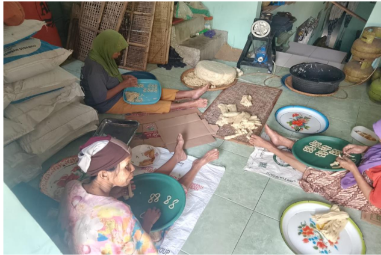
Gambar 2. Suasana pembuatan lanting singkong

Usaha makanan lanting memberikan dampak ekonomi yang signifikan bagi keluarga yang mengelolanya. Sebagai sumber mata pencaharian utama atau tambahan, usaha ini mampu meningkatkan pendapatan keluarga, terutama di daerah pedesaan. Produksi lanting yang berbasis pada bahan baku lokal seperti singkong memungkinkan keluarga untuk mengurangi biaya produksi, karena bahan baku mudah didapatkan dan terjangkau.