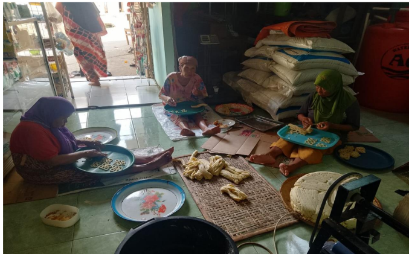
Gambar 1. Suasana mencetak lanting singkong

Secara keseluruhan, dinamika produksi dan pengelolaan usaha lanting menuntut keseimbangan antara mempertahankan tradisi dan inovasi dalam menjalankan bisnis. Dengan manajemen yang baik, usaha makanan lanting tidak hanya dapat bertahan di tengah persaingan pasar, tetapi juga berpotensi berkembang dan menjadi produk unggulan yang dikenal luas.