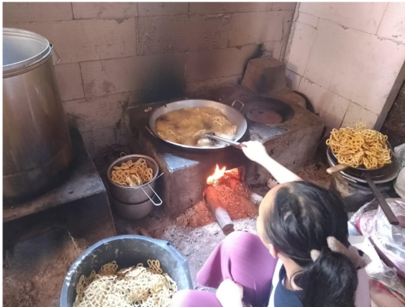
Gambar 3. Proses penggorengan lanting singkong

Usaha lanting juga memberikan kesempatan bagi perempuan untuk berpartisipasi aktif dalam ekonomi keluarga. Dalam banyak kasus, perempuan menjadi penggerak utama dalam produksi dan pemasaran lanting. Hal ini tidak hanya meningkatkan status ekonomi mereka, tetapi juga memberikan pengakuan sosial di dalam komunitas sebagai pelaku usaha yang berhasil. Dengan demikian, usaha lanting berperan dalam pemberdayaan perempuan dan peningkatan kesejahteraan sosial mereka.