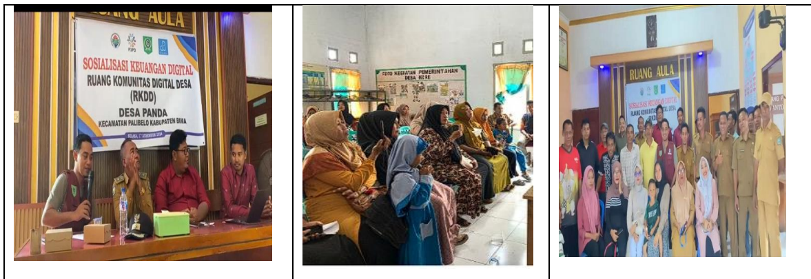
Gambar 2. Foto Kegiatan

Langkah Ketiga, Hasil evaluasi setelah pelatihan dan pendampingan telah menunjukkan bahwa pelaku UMKM sudah menggunakan aplikasi Akuntansi Umum (AKU) dalam proses penyusunan laporan keuangan usahanya. Setelah pelatihan dilaksanakan, terdapat peningkatan pemahaman peserta mengenai pencatatan laporan keuangan UMKM berbasis digital. Dalam pelatihan tersebut, pemahaman peserta mengenai pencatatan laporan keuangan UMKM mengalami peningkatan dari 20% meningkat menjadi 80%. Selain itu, setelah dilakukan pelatihan 100% peserta telah memahami dengan jelas semua fitur dalam aplikasi Akuntansi Umum (AKU) dan cara menggunakannya serta sudah menerapkan aplikasi tersebut dalam pencatatan laporan keuangan usahanya. Sehingga secara keseluruhan kegiatan pengabdian masyarakat ini sudah memenuhi indikator keberhasilan.