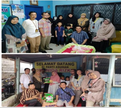
Gambar 3. Kunjungan ke Panti Asuhan Yuninda Rizki