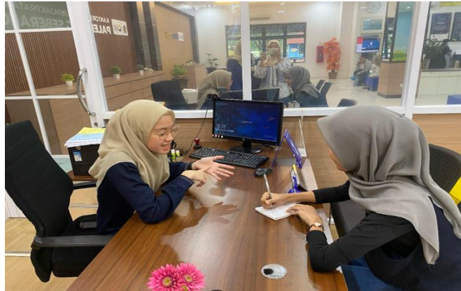
Gambar 2. Tahap Wawancara