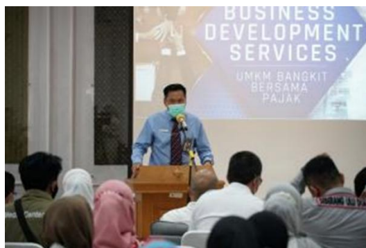
Gambar 6. Kegiatan BDS bersama pelaku UMKM di Aula KPP Pratama Palembang Seberang Ulu

Implementasi pada aspek planet , komitmen KPP Pratama Palembang Seberang Ulu terhadap pelestarian lingkungan tercermin dari upaya kpp menciptakan kantor yang bersih, asri dan ramah lingkungan. Selain itu, perawatan taman juga dilakukan secara rutin untuk mendukung kenyamanan kerja, serta kegiatan operasional beralih ke sistem digital untuk mengurangi limbah kertas. Kepedulian lingkungan ini juga ditujukan melalui partisipasi KPP dalam kegiatan penanaman pohon dalam rangka peringatan Hari Oeang Republik Indonesia ke- 77, seperti terlihat pada Gambar 5 yang terdokumentasi dengan baik. Meskipun telah berpartisipasi dalam program nasional, upaya pelestarian lingkungan pada KPP Pratama Palembang Seberang Ulu masih harus ditingkatkan, karena hingga saat ini belum ada inisiatif mandiri seperti kegiatan penghijauan bersama masyarakat yang dapat berpotensi memperluas dampak lingkungan dan mempererat hubungan baik dengan masyarakat sekitar.