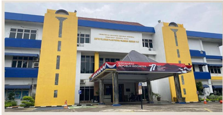
Gambar 1. Gedung KPP Pratama Palembang Seberang Ulu