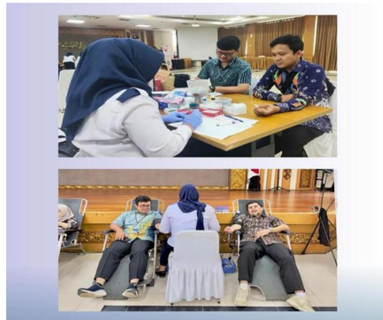
Gambar 4. Kegiatan Donor Darah di Panti Sosial Lanjut Usia Harapan Kita

Penerapan konsep TBL pada aspek people tercermin dalam upaya KPP Pratama Palembang Seberang Ulu dalam membangun hubungan yang harmonis dengan masyarakat. Komitmen ini diwujudkan melalui berbagai program CSR seperti santunan rutin kepada panti asuhan yang berada di wilayah Seberang Ulu salah satunya Panti Asuhan Yuninda Rizki seperti yang ditunjukkan pada gambar 3. Selain itu kegiatan donor darah yang dilaksanakan pada peringatan Hari Pajak ditunjukkan pada gambar 4 yang bertempat di Panti Sosial Lanjut Usia Harapan Kita sebagai bentuk nyata perhatian institusi terhadap kelompok masyarakat rentan. Upaya ini sejalan dengan penelitian (Ariastini, N. N., & Semara, 2019) tentang penerapan TBL pada CSR Hotel Alila Seminyak Bali, di mana aspek people dijalankan melalui kegiatan donasi kepada sekolah dan pemberdayaan masyarakat lokal yang menunjukkan bahwa hubungan masyarakat dan perusahaan dapat terbangun dengan baik melalui kegiatan sosial tersebut. Kegiatan tersebut merupakan salah satu bentuk nyata kepedulian dan empati KPP terhadap masyarakat, seperti terlihat pada Gambar 3 dan 4 yang terdokumentasi dengan baik.