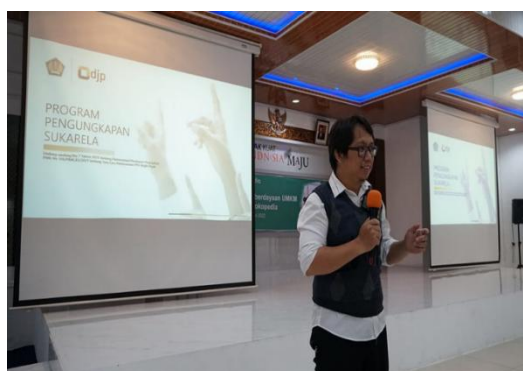
Gambar 7 Kolaborasi KPP Pratama Palembang Seberang Ulu dan Filantara dalam Edukasi Digital Marketing untuk UMKM

Implementasi pada aspek profit , CSR bagi instansi pemerintah tidak berfokus pada keuntungan finansial, melainkan pada efisiensi operasional, optimalisasi pelayanan, serta kontribusi terhadap penerimaan negara. Komitmen ini tercermin pada kegiatan pembinaan