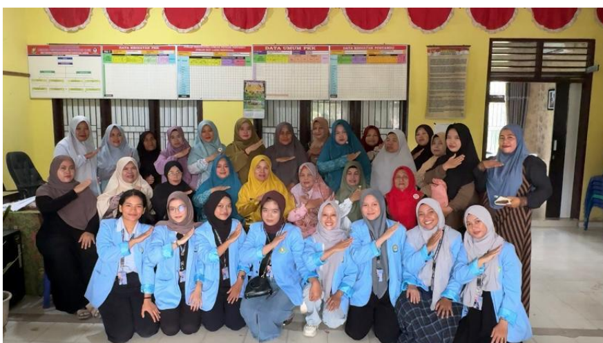
Gambar 3. Mahasiswi KUKERTA Bersama ibu-ibu PKK

Hasil observasi ini memberikan Gambaran yang kompleks mengenai pemahaman Masyarakat tentang hak-hak Perempuan dan anak di Desa Tanjung Rambutan. Meskipun kesadaran Masyarakat sudah cukup tinggi, namun masih terdapat beberapa tantangan yang perlu diatasi, seperti kesenjangan antara pemahaman teoritis dan praktik sehari-hari, serta kebutuhan untuk meningkatkan pengetahuan Masyarakat mengenai regulasi yang ada. Kegiatan Pengabdian Masyarakat ini telah dilakukan sesuai tahap yang direncanakan. Kegiatan ini dilakukan bersama masyarakat khususnya Ibu-Ibu PKK. Pada Gambar 3 adalah dokumentasi kegiatan sosialisasi yang dilaksanakan di Kantor Desa Tanjung Rambutan.