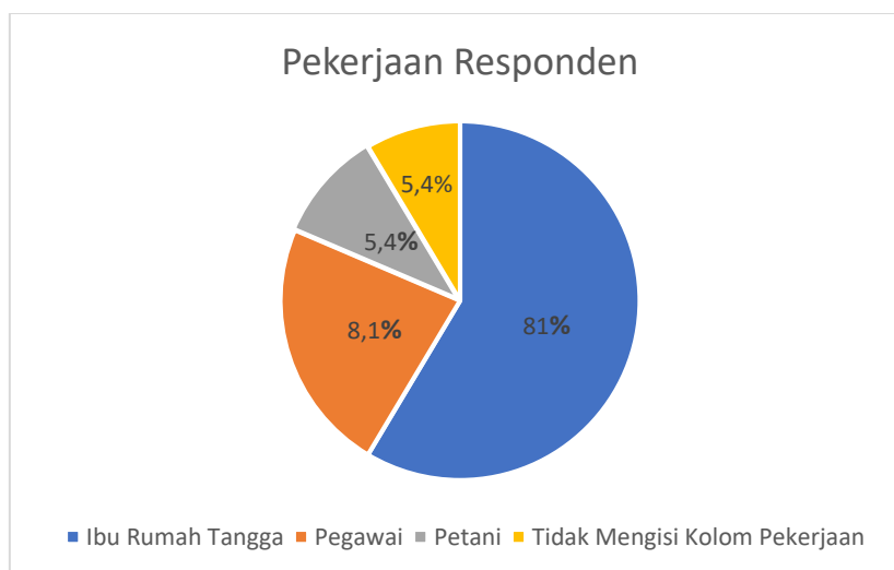
Gambar 2. Pekerjaan Responden

Berdasarkan kelompok pekerjaan, responden yang memiliki pekerjaan Pegawai (PNS/Swasta) sebanyak 3 orang (8,1%). Kemudian responden yang berkerja sebagai petani yaitu sebanyak 2 orang (5,4%). Lalu komposisi responden kelompok Ibu Rumah Tangga (IRT) cukup besar dan mendominasi yakni sebanyak 30 orang (81%). Sedangkan kelompok responden yang tidak mengisi kolom pekerjaan yakni sebanyak 2 orang (5,4%).