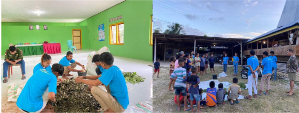
Gambar 3. Proses Pembuatan Pupuk Bokashi, bertempat di Balai Pertemuan Rakyat dan Kampung Bondo Kabala, Desa Mata Lombu

dibutuhkan untuk membuat pupuk bokashi, (2) kelompok melakukan realisasi atau implementasi kegiatan yakni pembuatan pupuk.