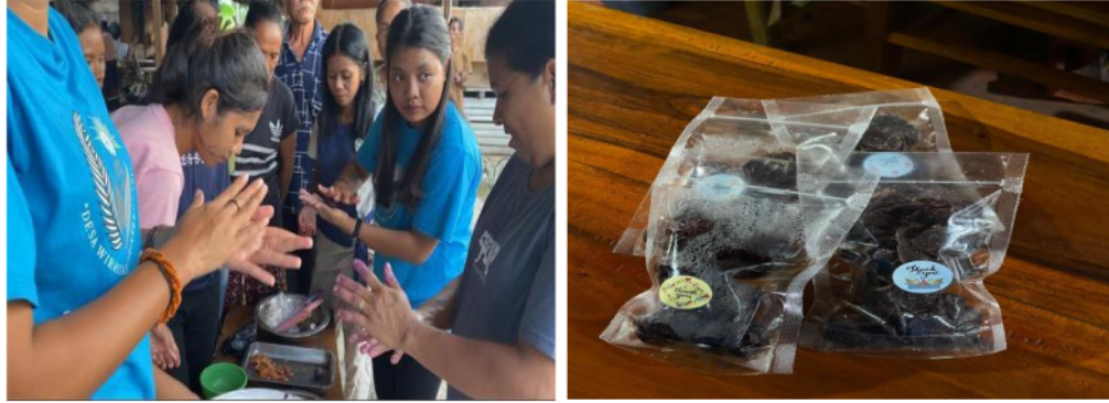
Gambar 2. Pelatihan dan Pengolahan UMKM Pangan Lokal, bertempat di Kampung Bondo Kabala, Desa Mata Lombu