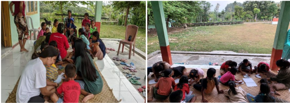
Gambar 5. Proses Bimbingan Belajar Tingkat PAUD, SD, dan SMP di Kantor Desa Mata Lombu

Kegiatan ini dilakukan sebanyak dua kali dalam satu bulan bertempat di Kantor Desa Mata Lombu dimulai pada tanggal 24 Juni 2024 hingga 24 Juli 2024. Kegiatan dilakukan melalui dua tahap, yaitu; (1) kelompok memberikan materi pembelajaran terkait dengan pengenalan huruf, suku kata, kata, dan kalimat, membaca nyaring, pemahaman bacaan, kosakata, tata bahasa, menulis huruf, menulis kata dan kalimat, operasi matematika dasar (penjumlahan, pengurangan, perkalian, dan pembagian), bilangan bulat, (2) kelompok memberikan tugas dan pekerjaan rumah sebagai bentuk pelatihan individu bagi para siswa-siswi selain dengan bimbingan belajar (Gambar 5).