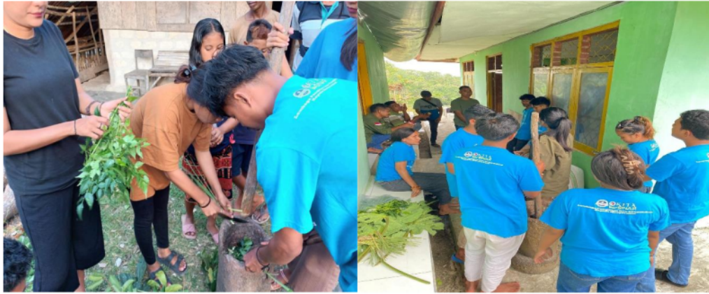
Gambar 4. Implementasi Program Pelatihan Pembuatan Pestisida Alami di Balai Pertemuan Rakyat dan Kampung Bondo Kabala, Desa Mata Lombu

petani pada tanggal 12 Juli 2024. Kegiatan ini dilakukan dengan dua tahap, yaitu (1) kelompok memberikan Sosialisasi terkait manfaat dan tujuan serta bahan yang dibutuhkan untuk membuat pestisida alami, (2) kelompok melakukan realisasi atau implementasi kegiatan yakni pembuatan pestisida alami.