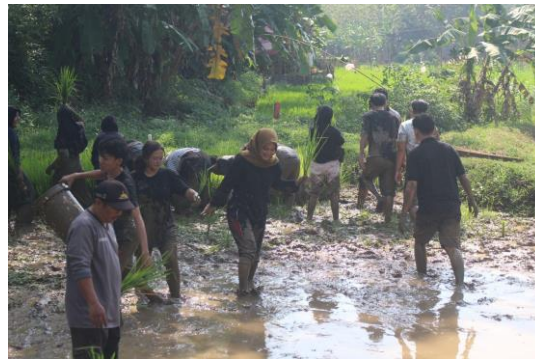
Gambar 5. Kegiatan launching produk dan field trip

tumbuhan. keberhasilan kegiatan ini ditandai dengan kegiatan yang berjalan sesuai rencana, serta besarnya antusias peserta dalam mengikuti launching paket wisata baru tersebut.