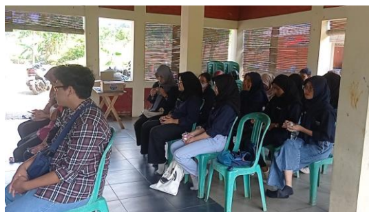
Gambar 3. Sosialisasi dengan pihak Omah Pinter Petani

Tahapan pada kegiatan kedua berupa pendampingan dan pelatihan dalam pembuatan pupuk organik dari limbah kulit durian yang dilakukan pada tanggal 16 juli 2023 pukul 09.00- 11.30 WIB. Setelah kegiatan sosialisasi yang bertujuan memberikan pemahaman pada anggota OPP terkait program penambahan paket wisata dengan melakukan pengolahan limbah kulit