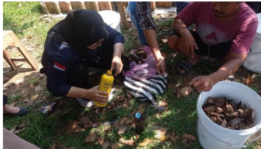
Gambar 4. Pendampingan dan Pelatihan pembuatan pupuk organik

durian menjadi pupuk organik, pada tahap pendampingan dan pelatihan ini mahasiswa geografi memberikan pelatihan atau tahapan dalam teknik pemotongan kulit durian, penambahan cairan EM4 dan Molases, lamanya waktu fermentasi dan pengendapan, hingga membuat sampel produk pupuk organik dari limbah kulit durian. Kegiatan ini diikuti oleh anggota OPP yang sangat antusias dalam pembuatan produk untuk penambahan paket wisata.