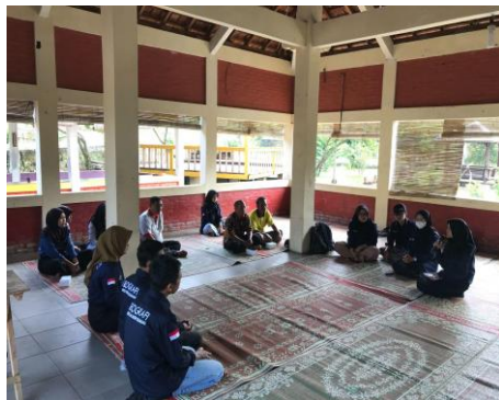
Gambar 2. Koordinasi dengan pihak Omah Pinter Petani

Kegiatan pertama dalam pengabdian kepada masyarakat ini berupa pengenalan dan sosialisasi program pengolahan kulit durian untuk paket wisata dilakukan pada tanggal 19 juni 2023 pukul 08.00- 10.00 WIB. Pada kegiatan sosialisasi ini merupakan penyampaian tujuan dari program pengabdian, penyampaian timeline atau rangkaian kegiatan yang akan dilaksanakan, serta melakukan diskusi untuk penyamaan persepsi serta pemahaman dari himpunan mahasiswa geografi kepada anggota OPP terkait pengolahan limbah kulit durian menjadi pupuk organik sebagai tambahan dalam paket wisata untuk OPP. Dalam sosialisasi ini banyak anggota OPP yang hadir sehingga mahasiswa dapat memberikan penjelasan terkait potensi wilayah desa kandri yang salah satunya penghasil komoditas durian, sehingga berpotensi menghasilkan banyak limbah kulit durian yang tidak terpakai dan dibiarkan begitu saja. Permasalahan tersebut yang akhirnya membuat mahasiswa geografi berinovasi untuk memanfaatkan limbah kulit durian menjadi salah satu paket wisata OPP yang dinilai dapat menambah daya tarik serta dapat mengatasi permasalahan limbah kulit durian dengan mengolahnya menjadi pupuk organik.