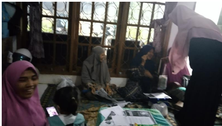
Gambar 1. Penyuluhan tentang DAGUSIBU.

Kegiatan Pengabdian Masyarakat ini telah dilaksanakan sesuai dengan tahapan yang direncanakan sejak awal, dimulai dengan penyuluhan mengenai prinsip-prinsip DAGUSIBU (Dapatkan, Gunakan, Simpan, dan Buang Obat dengan Benar) kepada ibu-ibu PKK di Desa Kedungpring. Kegiatan ini dilakukan secara kolaboratif antara Masyarakat dan tim pengmas. Pada Gambar 1 dapat dilihat proses penyuluhan yang dilakukan dengan interaktif, di mana ibu-ibu PKK aktif berpartisipasi. Sedangkan pada Gambar 2 adalah foto bersama setelah kegiatan pengabdian masyarakat selesai dilaksanakan, sebagai tanda keberhasilan kegiatan yang telah membawa perubahan positif dalam pengetahuan dan perilaku masyarakat mengenai pengelolaan obat yang aman.