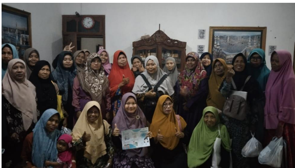
Gambar 2. Foto Bersama Peserta Penyuluhan DAGUSIBU.