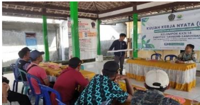
Gambar 2. Demonstrasi penggunaan alat semai pupuk

Acara kemudian dimulai dengan sambutan dari Kepala Desa Pamotan yang menekankan pentingnya inovasi sederhana untuk memudahkan pekerjaan petani sambil meningkatkan produktivitas. Pidato selanjutnya dari Sekretaris Desa menyampaikan apresiasi terhadap program layanan ini karena sesuai dengan kebutuhan nyata komunitas petani tembakau di Desa Pamotan. Setelah itu, tim layanan menyampaikan tujuan utama program kerja, yaitu memperkenalkan teknologi yang sesuai berupa alat penabur pupuk manual berbahan PVC yang dapat membantu petani memupuk secara lebih efisien, baik dari segi waktu, tenaga, maupun jumlah pupuk yang digunakan. Penjelasan ini juga bertujuan untuk meningkatkan pengetahuan petani tentang pentingnya efisiensi pupuk dan mendorong perubahan perilaku menuju praktik pertanian yang lebih efisien dan berkelanjutan, di mana proses penyampaian materi dilakukan sebagaimana ditunjukkan pada Gambar 2 .