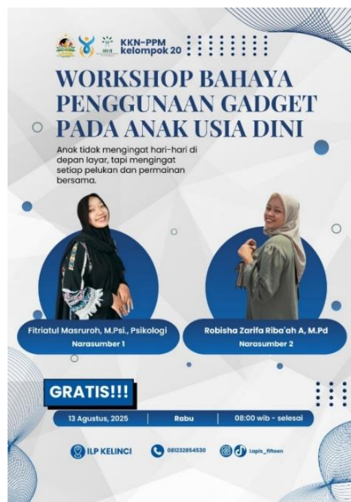
Gambar 1. Poster Promosi Kegiatan.

Kegiatan pengabdian masyarakat terdiri dari tiga tahap utama: persiapan, pelaksanaan, dan evaluasi. Berikut langkah-langkah yang telah dilakukan pada setiap tahap persiapan, yaitu membentuk tim pengabdian yang terdiri dari mahasiswa dan dosen UNIIB yang memiliki keahlian di bidang pendidikan, bekerja sama dengan kader Posyandu ILP Kelinci di Desa Keradenan, kemudian menyusun rencana kegiatan secara detail, meliputi tujuan seminar, target peserta, materi yang akan disampaikan, metode penyampaian, lokasi, dan jadwal pelaksanaan. Sebelum pelaksanaan, tim melakukan workshop sosialisasi tentang bahaya penggunaan gawai untuk mempromosikan kegiatan dan mengajak peserta berpartisipasi.