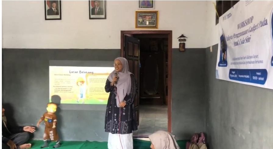
Gambar 4. Penyampaian Materi Oleh Narasumber