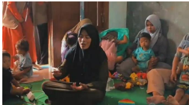
Gambar 3. Salah Satu Peserta sedang Bertanya.

Kegiatan pengabdian masyarakat berjalan lancar, dengan orang tua yang terlibat aktif dan menyaksikan langsung manfaatnya. Mereka menyadari banyaknya wawasan yang diperoleh, termasuk pengaruh signifikan gawai terhadap perkembangan anak usia dini. Presentasinya metodis dan terorganisir, sehingga memudahkan peserta memahami informasi. Gambar berikutnya menunjukkan seorang pembicara menyampaikan materi bersama seorang peserta workshop.