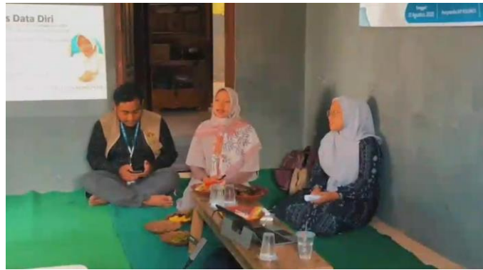
Gambar 2. Pembukaan Acara oleh MC.

Berdasarkan jawaban dari orang tua tersebut dapat diketahui bahwa gadget diberikan kepada anak agar orang tua merasa mudah dalam menjaga dan mengawasi anak. Pemberian materi dari masing-masing narasumber pun berjalan, semuanya berkaitan dengan bahaya penggunaan gadget di usia dini.