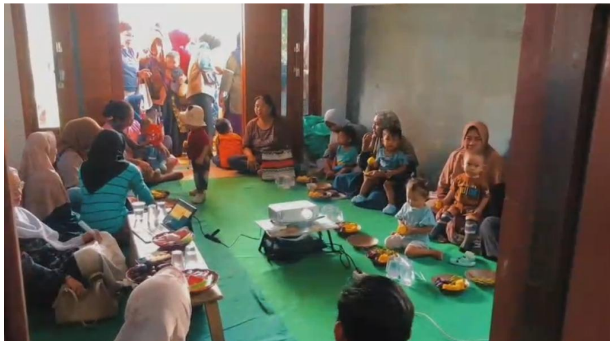
Gambar 5. Peserta Workshop

Setelah penyampaian materi, peserta diberikan kesempatan untuk bertanya atau berdiskusi mengenai materi yang disampaikan. Staf memoderasi diskusi secara efektif dan menjawab pertanyaan peserta dengan jelas dan menyeluruh. Kegiatan workshop tentang bahaya penggunaan gadget pada anak usia dini yang diselenggarakan di Posyandu ILP Kelinci menunjukkan bahwa peserta menunjukkan antusiasme yang tinggi terhadap materi yang disampaikan, terbukti dari hasil observasi selama sesi dan keterlibatan aktif dalam sesi tanya jawab, di mana peserta dengan antusias mengajukan pertanyaan kepada pembicara.