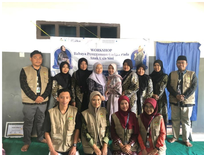
Gambar 7. Foto Bersama Narasumber, Panitia, dan Kader Posyandu.

Berdasarkan hasil evaluasi dapat diketahui bahwa peserta sudah memahami apa yang disampaikan narasumber terkait penggunaan gadget pada anak dampak positif dan negatifnya, dan apa yang didapatkan selama workshop akan diterapkan kepada kegiatan sehari-hari terutama gadget untuk anak usia dini. Hal ini menunjukkan bahwa kegiatan workshop telah dilaksanakan sesuai dengan harapan, tujuan, dan target yang ingin dicapai. Rangkaian kegiatan diakhiri dengan foto bersama panitia, kader Posyandu, dan narasumber.