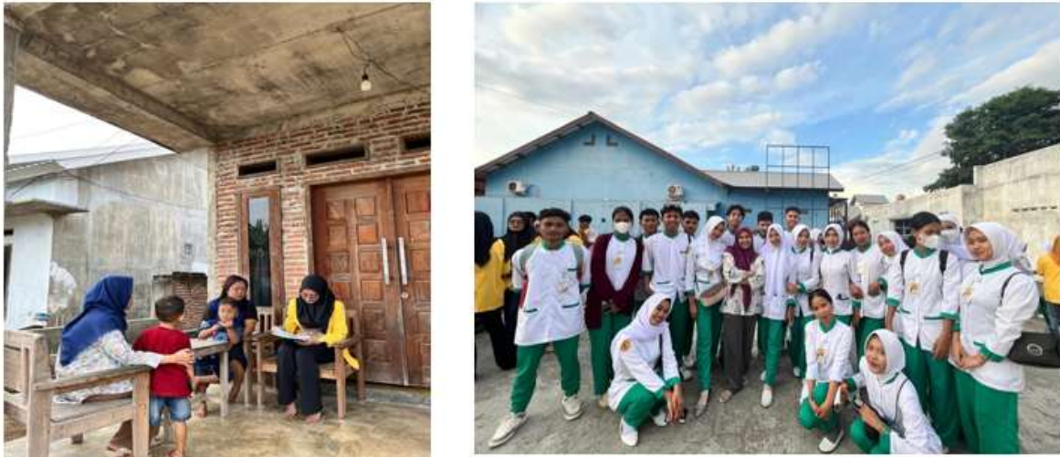
Gambar 1 Pelaksanaan penyuluhan secara door to door ke masyarakat pesisir

Pada gambar 3.1 merupakan pelaksanaan kegiatan penyuluhan tentang PHBS kepada masyarakat pesisir, dari kegiatan penyuluhan ini masyarakat sangat antusias mendengarkan semua yang disampaikan oleh penyuluh dan masyarakat sangat berharap masalah sampah di daerah pesisir segera tertangani dan ada penyelesaiannya agar masyarakat tidak membuang sampah di laut.