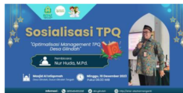
Gambar 8. Optimalisasi Manajemen Guru TPQ Desa Glindah melalui Pendampingan Intensif Bersama KSPPS BMT Khoiru Ummah