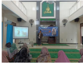
Gambar 9. Pemateri Menyampaikan Materi