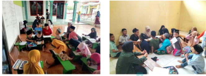
Gambar 2 & 3. Observasi ke TPQ di Desa Glindah