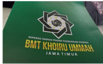
Gambar 7. Mengkomunikasikan dengan KSPPS BMT KHOIRU UMMAH