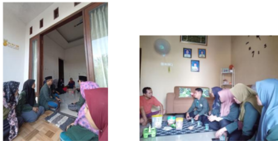
Gambar 4 & 5. Mengkomunikasikan Rencana Pendampingan dengan Tokoh Masyarakat dan Tokoh Agama