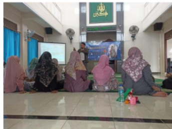
Gambar 10. Pemateri Menjawab Pertanyaan yang Diajukan Audiens

Setelah pemateri menyampaikan materi, pemateri memberikan kesempatan kepada Audiens untuk mengajukan pertanyaan terkait manajemen di TPQ. Secara empirik, setelah didiskusikan terdapat hasil pembahasan dimana disitu ditemukant beberapa permasalahan yang dialami guru terkait manajemen TPQ, antara lain belum maksimalnya pemahaman konsep dasar manajemen TPQ, guru masih belum mengatur waktu dengan baik ketika mengajar di TPQ, guru hanya melaksanakan sebagian dari inti manajemen yaitu membaca, menulis, dan menghafal. Karena pembelajaran yang monoton yang membuat para santri bosan dengan pembelajaran yang diberikan guru di TPQ.