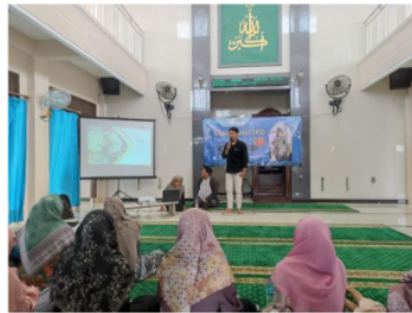
Gambar 3. Sambutan dari KSPPS BMT Khoiru Ummah Jawa Timur

Kegiatan pelatihan ini diakhiri dengan penyerahan bingkisan kepada pengurus dan guru TPQ sebagai wujud bakti sosial dari KSPPS BBMT Khoiru Ummah Jawa Timur yang mendanai seluruh proses pendampingan, Piagam penghargaan kepada kepala dan guru TPQ juga diberikan sebagai wujud ikatan sambung silaturahmi antara pihak kampus dengan masyarakat