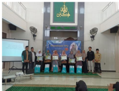
Gambar 4. Penyerahan Bakti Sosial dan Penyerahan Piagam Penghargaan Kepada Kepala dan Guru TPQ Se-Desa Glindah