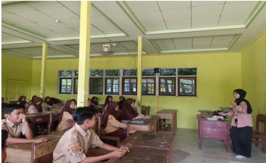
Gambar 4. Pembelajaran macam-macam tenses di kelas 9 MTs Sabial Muhtadin

pengalaman mengajar bahasa Inggris dan melibatkan mereka dalam proses pendidikan. Para pendidik ini terlibat dalam kegiatan kelas seperti diskusi kelompok dan simulasi percakapan selain memberikan pengajaran akademis. Untuk meningkatkan antusiasme siswa dalam belajar bahasa Inggris, mahasiswa KKN sering menciptakan kegiatan yang memotivasi siswa. Proyek multimedia, debat tematik, dan permainan edukatif adalah beberapa kegiatan yang mendorong partisipasi siswa di dalam kelas. Selain memberikan hiburan yang menyenangkan bagi siswa, permainan ini juga merupakan alat yang berguna untuk meningkatkan kemampuan bahasa Inggris mereka. Berdasarkan observasi lapangan, tingkat keterlibatan aktif siswa dalam proses pembelajaran meningkat secara signifikan ketika solusi tersebut diterapkan. Siswa mulai merespons topik yang dibahas dan mengungkapkan pemikiran mereka dengan lebih spontan. Keterlibatan aktif mereka dalam kegiatan kelas menunjukkan peningkatan yang signifikan dalam antusiasme mereka untuk belajar. Secara keseluruhan, dengan menggunakan strategi pengajaran yang kreatif dan dipersonalisasi, program KKN telah berhasil menangani beberapa masalah utama yang dihadapi MTS Sabial Muhtadin. Berdasarkan observasi lapangan, mayoritas siswa mengalami peningkatan yang signifikan dalam antusiasme belajar, kemampuan bahasa Inggris, dan keterlibatan aktif dalam proses pendidikan.