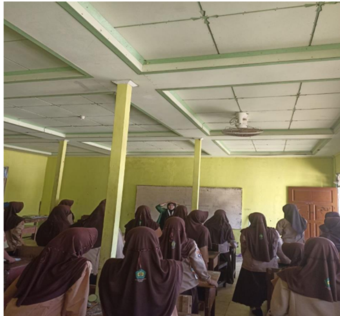
Gambar 2. Belajar Bahasa Inggris sambil bermain game

isu-isu yang dibahas dan menyampaikan pendapat mereka secara lebih spontan. Peningkatan ini tidak hanya menunjukkan bahwa keterampilan verbal siswa telah membaik, tetapi juga menunjukkan bahwa mereka lebih siap menghadapi tantangan komunikasi di masa depan.