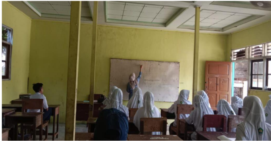
Gambar 3. Pembelajaran Vocabulary Bersama siswa siswi kelas 9 MTs Sabilal Muhtadin

interaktif. Selain mendorong motivasi belajar, latihan kolaboratif ini membantu mereka mengembangkan keterampilan sosial yang penting untuk pertumbuhan pribadi mereka. Mahasiswa KKN dapat memantau perkembangan nyata dan memberikan masukan yang relevan untuk meningkatkan pendekatan pengajaran. Berdasarkan observasi lapangan, siswa semakin nyaman dalam mengungkapkan pikiran dan keyakinan mereka. Ketika menyampaikan pendapat dan menanggapi topik yang dibahas, mereka cenderung lebih spontan. Keterlibatan aktif mereka dalam kegiatan kelas menunjukkan peningkatan signifikan dalam antusiasme mereka untuk belajar. Secara keseluruhan, dengan mengintegrasikan strategi pengajaran yang menarik dan menyenangkan, program KKN telah berhasil meningkatkan motivasi belajar siswa MTS Sabilal Muhtadin. Berdasarkan observasi lapangan, mayoritas siswa melaporkan peningkatan yang signifikan dalam antusiasme mereka untuk belajar, yang sejalan dengan temuan penelitian bahwa penggunaan teknik interaktif dapat meningkatkan keterlibatan dan minat siswa dalam proses pendidikan.