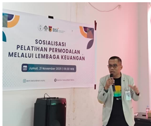
Gambar 7. Sesi Diskusi dan Tanya Jawab (hari kedua).

Pelatihan ini mengacu pada temuan Mahardika dan Rizcho (2020), Penjelasan ini merujuk pada temuan penelitian yang menunjukkan bahwa meskipun UMKM menjadi penopang penting perekonomian, tingkat literasi keuangan, akses pembiayaan, dan kinerja pengelolaan keuangannya masih belum optimal. Hambatan utama yang ditemukan meliputi rendahnya pemahaman keuangan, persyaratan pembiayaan yang sulit dipenuhi, serta kemampuan pengelolaan usaha yang masih terbatas.