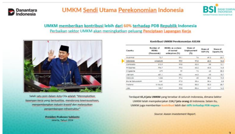
Gambar 6. Pemaparan Materi Oleh Pihak BSI Kc Palu Gajah Mada mengenai Pelatihan Permodalan Melalui Lembaga Keuangan dan Arus Buku Kas.

Kegiatan dilanjutkan dengan pelatihan permodalan yang difokuskan pada bagaimana UMKM dapat mengakses pendanaan melalui lembaga keuangan. Materi disampaikan dengan pendekatan yang sederhana namun aplikatif, sehingga peserta memahami alur pengajuan pembiayaan, jenis-jenis produk keuangan, serta persyaratan administrasi yang diperlukan.