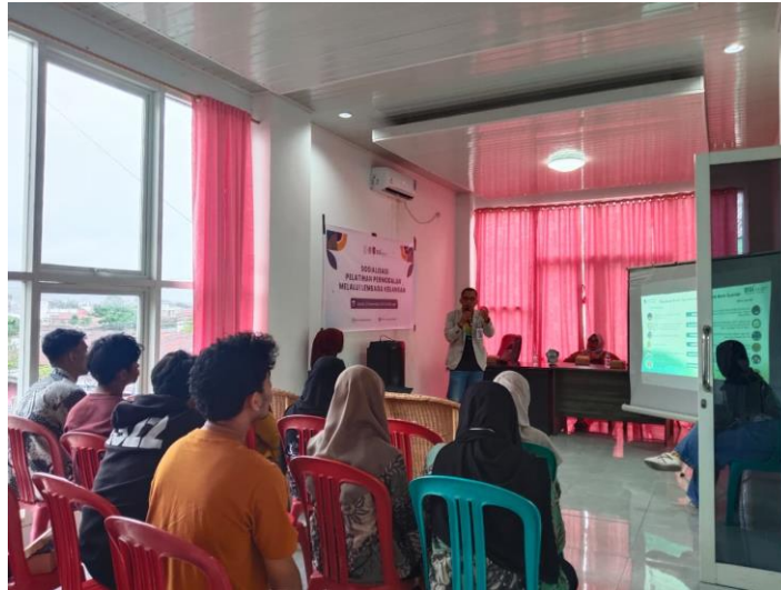
Gambar 5. Pemaparan Materi Oleh Pihak BSI Kc Palu Gajah Mada mengenai Pelatihan Permodalan Melalui Lembaga Keuangan dan Arus Buku Kas.