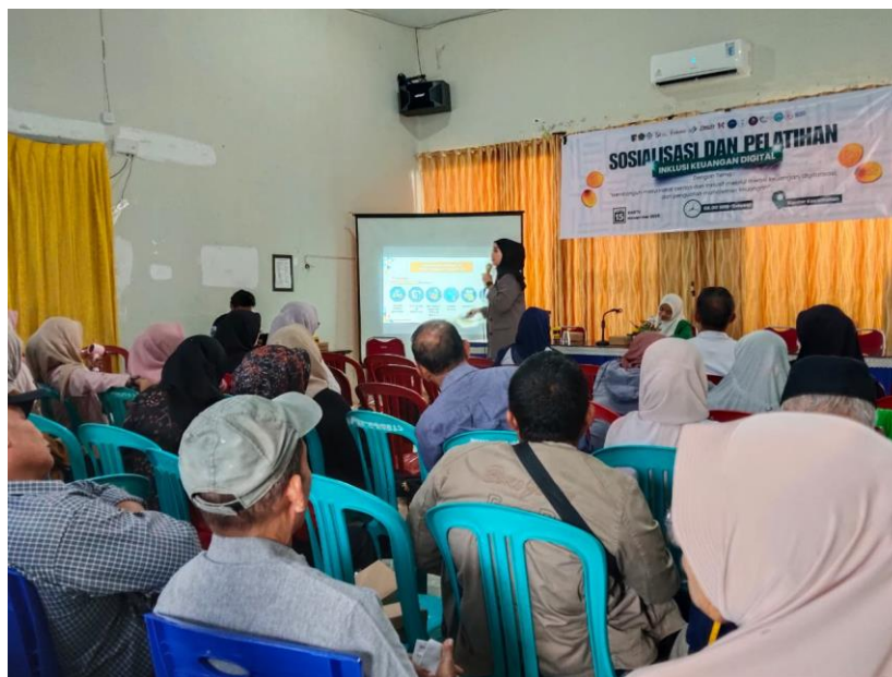
Gambar 3. Pemaparan Materi Oleh Pihak OJK Sulteng mengenai Literasi Keuangan, Pelatihan Inklusi Keuangan dan Manajemen Keuangan.

Pelaksanaan kegiatan pengabdian masyarakat dengan tema “Pengembangan Kapasitas UMKM melalui Literasi Keuangan, Inklusi Keuangan, dan Pelatihan Permodalan di Kecamatan Tatanga dan Kelurahan Nunu” berlangsung secara komprehensif, partisipatif, dan terarah. Seluruh rangkaian kegiatan dirancang untuk menjawab kebutuhan UMKM terhadap peningkatan kapasitas pengelolaan keuangan, akses permodalan, dan kemampuan adaptasi terhadap perkembangan sistem keuangan modern. Kegiatan dilaksanakan melalui beberapa tahap yang saling berkesinambungan, mulai dari sosialisasi dan pelatihan, sesi diskusi, hingga evaluasi pemahaman peserta. Pelibatan aktif para pelaku UMKM menjadi kunci penting agar proses pembelajaran berjalan efektif dan relevan dengan kondisi usaha mereka (Muhammad Astri Yulidar Abbas et al., 2025).