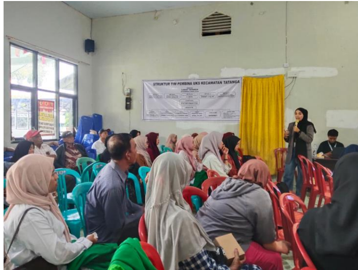
Gambar 4. Sesi Diskusi dan Tanya Jawab (hari pertama).

Kegiatan ini sejalan dengan temuan penelitian Deri Apriadi et al. (2025) yang menunjukkan bahwa peningkatan literasi keuangan mampu memperkuat kemandirian finansial, memperbaiki kemampuan pencatatan usaha, serta meningkatkan kualitas pengambilan keputusan para pelaku UMKM dalam mengelola bisnisnya secara berkelanjutan.