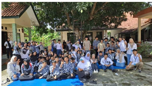
Gambar 4. Foto Bersama setelah pembuatan Gelang