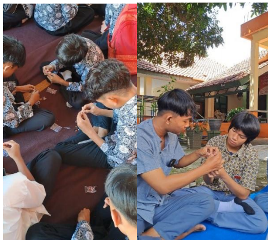
Gambar 3. Pelaksanaan Pembuatan Gelang