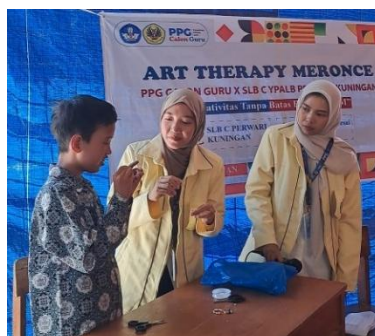
Gambar 2. Mendemonstrasikan Pembuatan Gelang