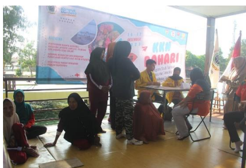
Gambar 5. Pemberian Vitamin

Sebagai tindak lanjut dari hasil skrining dan penyuluhan, tim pengabdian masyarakat melakukan pemberian vitamin kepada warga sekitar RPTRA Pulau Pramuka. Langkah ini diambil sebagai bentuk kepedulian dan upaya konkret untuk mendukung peningkatan status gizi masyarakat. Pemberian suplemen vitamin ini diharapkan dapat membantu memperkuat sistem kekebalan tubuh dan menutupi kemungkinan kekurangan nutrisi dalam pola makan sehari-hari penduduk pulau.