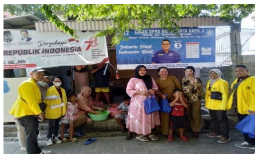
Gambar 1. Penyuluhan Sanitasi Hygiene

Pada sesi pertama, fokus diberikan pada aspek sanitasi hygiene dengan tujuan memberikan pemahaman komprehensif kepada masyarakat setempat. Materi yang disampaikan mencakup definisi, karakteristik, proses, penyebab, pengaruh, serta prosedur pencegahan terkait sanitasi dan kebersihan. Metode evaluasi yang diterapkan berupa pengisian kuesioner sebelum dan sesudah penyuluhan menunjukkan hasil yang sangat positif. Dari 20 responden yang berpartisipasi, terjadi peningkatan signifikan dalam tingkat pengetahuan peserta tentang bahaya sanitasi hygiene, dari 50% sebelum penyuluhan menjadi 85% setelahnya. Peningkatan sebesar 35% ini mengindikasikan efektivitas penyuluhan dalam mentransfer pengetahuan dan meningkatkan kesadaran masyarakat.