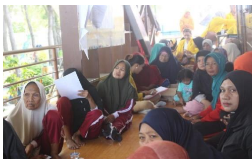
Gambar 3. Penyuluhan Penyakit Degeneratif

Penyuluhan penyakit degeneratif menjadi langkah awal yang krusial dalam rangkaian kegiatan ini. Fokus utamanya adalah memberikan edukasi kepada warga Pulau Pramuka mengenai penyakit-penyakit yang sering dijumpai di wilayah tersebut, seperti hipertensi, kolesterol tinggi, dan asam urat. Melalui sesi penyuluhan, diskusi interaktif, dan pengisian kuesioner, diharapkan masyarakat dapat memperoleh pemahaman yang lebih mendalam tentang faktor risiko, gejala, dan langkah-langkah pencegahan penyakit degeneratif. Kegiatan ini tidak hanya bertujuan untuk meningkatkan pengetahuan, tetapi juga mendorong perubahan gaya hidup yang lebih sehat di kalangan penduduk Pulau Pramuka.