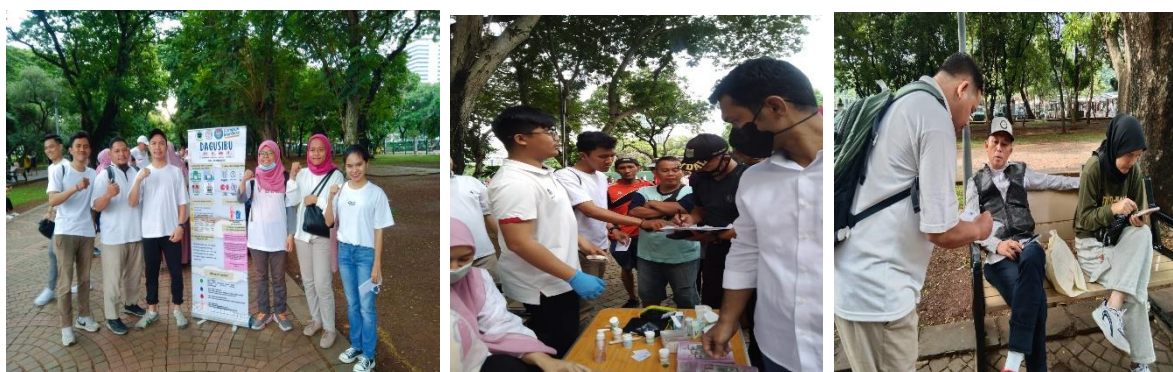
Gambar 8. Edukasi DAGUSIBU di Monas

Pada hari Minggu, 25 Februari 2024, sebagai bagian integral dari rangkaian kegiatan Kuliah Kerja Nyata (KKN), dilaksanakan program sosialisasi kesehatan yang berfokus pada DAGUSIBU (Dapatkan, GUnakan, SIMpan, dan BUang obat) di kawasan ikonik Monumen Nasional (Monas) Jakarta. Pemilihan lokasi ini tidak hanya strategis dari segi aksesibilitas dan visibilitas, tetapi juga memiliki nilai simbolis sebagai pusat kegiatan masyarakat di ibukota, memungkinkan jangkauan yang luas dan beragam dari berbagai lapisan masyarakat.