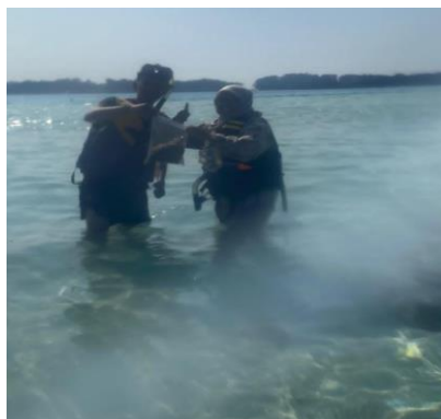
Gambar 7. Pencarian Biota Laut

Tahap selanjutnya dari rangkaian KKN ini yaitu melibatkan dua kegiatan yaitu pencarian biota laut di Pulau Air, Kepulauan Seribu pada 17 Desember 2023, dan skrining fitokimia biota laut yang telah dikeringkan pada 2 Februari 2024. Pencarian biota laut dilakukan dengan dukungan masyarakat setempat, menghasilkan penemuan rumput laut jenis lamun ( Cymodocea serrulata ). Pemilihan Pulau Air sebagai lokasi penelitian didasarkan pada kekayaan dan keragaman biota lautnya.