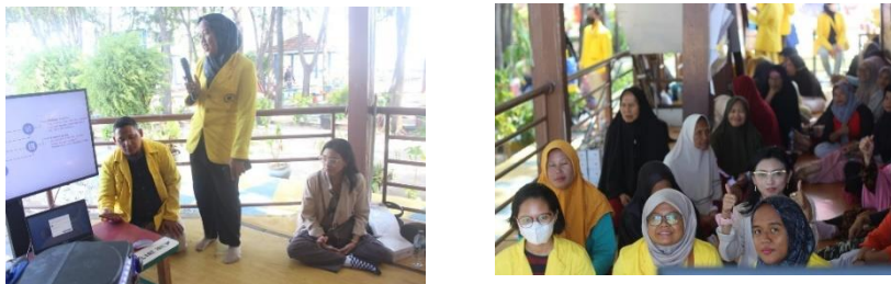
Gambar 2. Penyuluhan Manfaat Biota Laut

Penyuluhan ini mengedukasi masyarakat tentang beragam jenis makanan laut yang tersedia di perairan sekitar Pulau Pramuka, seperti rumput laut dan berbagai jenis ikan, yang memiliki potensi untuk membantu mencegah penyakit akibat sanitasi buruk. Respon positif dan antusiasme tinggi yang ditunjukkan oleh masyarakat terhadap materi ini mengindikasikan keberhasilan penyuluhan dalam membuka wawasan mereka tentang manfaat biota laut bagi kesehatan.