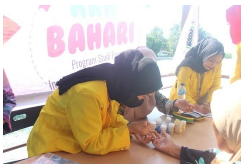
Gambar 4. Skrining Kesehatan

Seiring dengan penyuluhan, dilakukan pula skrining kesehatan yang meliputi pemeriksaan kadar gula darah, kolesterol, dan asam urat. Data yang terkumpul dari 22 peserta menunjukkan variasi hasil yang menarik. Beberapa temuan penting termasuk kecenderungan kadar kolesterol yang tinggi di antara penduduk, dengan beberapa peserta memiliki nilai di atas 200 mg/dL. Selain itu, terdapat pula kasus-kasus dengan kadar gula darah dan asam urat yang melebihi batas normal. Hasil skrining ini memberikan gambaran nyata tentang kondisi kesehatan masyarakat Pulau Pramuka dan menjadi dasar untuk intervensi kesehatan yang lebih tepat sasaran di masa mendatang.