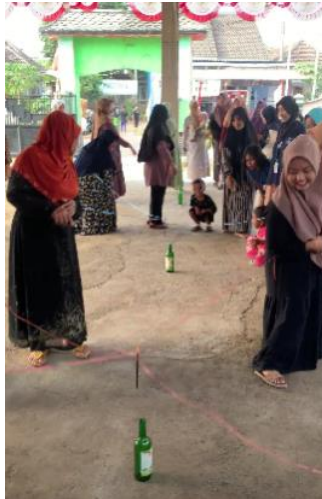
Gambar 13 Keseruan Lomba Ibu-Ibu PKK

Kegiatan Lajuk Bersholawat yang menjadi puncak dari rangkaian acara peringatan kemerdekaan di Desa Lajuk tidak hanya berhasil mempererat tali silaturahmi antarwarga, tetapi juga memberikan sentuhan spiritual yang mendalam dalam perayaan ini. Acara ini diorganisir dengan penuh kesungguhan, di mana mahasiswa KKN turut aktif dalam segala aspek persiapan, mulai dari koordinasi dengan tokoh-tokoh agama setempat hingga pengaturan logistik dan dekorasi acara. Partisipasi mahasiswa KKN sangat penting dalam memastikan acara berjalan dengan lancar dan sesuai dengan rencana. Mereka juga bekerja sama dengan pemuda desa dan ibu-ibu PKK untuk mempersiapkan tempat acara, mengatur jadwal, dan memastikan bahwa semua kebutuhan teknis terpenuhi. Kehadiran mahasiswa KKN dalam acara ini bukan hanya sebagai panitia, tetapi juga sebagai fasilitator yang menghubungkan berbagai elemen masyarakat agar acara dapat terlaksana dengan sukses.