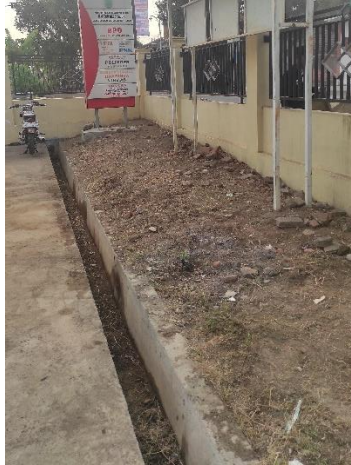
Gambar 4 Halaman Depan Balai Desa Sebelum Penghijauan

Lebih dari itu, partisipasi aktif masyarakat juga terlihat dalam inisiatif mereka untuk menyumbangkan sumber daya lokal, seperti tanah subur dan bahan organik, serta berbagi pengetahuan tradisional mereka tentang cara merawat tanaman di lingkungan setempat. Hal ini menunjukkan bahwa program ini tidak hanya memberikan manfaat praktis, tetapi juga mendorong terjadinya pertukaran pengetahuan antara tim KKN dan masyarakat.