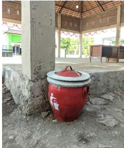
Gambar 7 Penempatan Tong Sampah

Dalam hal ini, masyarakat dilibatkan secara aktif dalam seluruh tahapan pelaksanaan program ini, mulai dari perencanaan, pemilihan lokasi pemasangan, hingga evaluasi efektivitas papan informasi dan tong sampah. Pendekatan partisipatif ini tidak hanya meningkatkan rasa memiliki dan tanggung jawab masyarakat terhadap fasilitas yang disediakan, tetapi juga memastikan bahwa solusi yang diimplementasikan benar-benar sesuai dengan kebutuhan dan kondisi lokal.