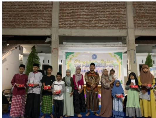
Gambar 8 Santunan Anak Yatim Bersama Kepala Desa Lajuk

Kegiatan istighosah yang dilakukan secara rutin telah menjadi wadah spiritual yang memperkuat ikatan sosial dan keagamaan di antara warga desa, sementara kegiatan santunan anak yatim memberikan perhatian dan dukungan yang sangat dibutuhkan oleh anak-anak yatim di desa tersebut (Mashuri, 2024). Partisipasi aktif dari ibu-ibu PKK dan anggota NU dalam kegiatan ini mencerminkan antusiasme masyarakat untuk memperdalam keimanan, mempererat silaturahmi, dan meningkatkan rasa empati serta kepedulian sosial terhadap anak-anak yang membutuhkan.