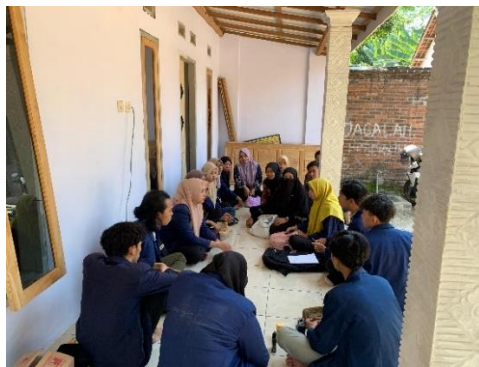
Gambar 3 Diskusi Bersama Pembahasan Program Kerja

Pada tahap awal, masyarakat dilibatkan dalam diskusi terbuka untuk mengidentifikasi permasalahan lingkungan yang ada dan bagaimana bunga pucuk merah dapat menjadi solusi. Proses ini mendorong mereka untuk lebih memahami manfaat ekologis dan estetika dari tanaman tersebut. Masyarakat kemudian dilibatkan dalam pemilihan lokasi pembibitan, penentuan metode pembibitan yang sesuai, hingga dalam kegiatan perawatan bibit secara langsung. Keterlibatan ini meningkatkan rasa memiliki terhadap program, yang pada akhirnya memotivasi masyarakat untuk menjaga keberlanjutan kegiatan ini di masa mendatang (Mardiati et al., 2023; Marjaenah, 2018; Yusuf, 2022).