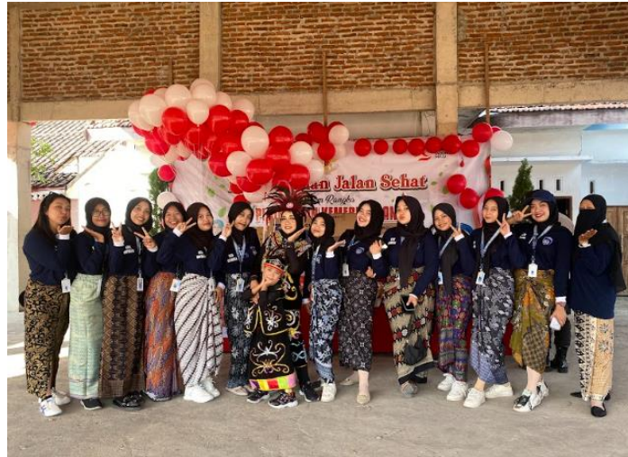
Gambar 12 Giat Sebelum Karnaval Desa Lajuk

Selain karnaval, ibu-ibu PKK juga berperan aktif bersama mahasiswa KKN dalam menyusun berbagai lomba yang dirancang untuk menambah semarak acara kemerdekaan. Lomba-lomba ini tidak hanya menarik perhatian masyarakat luas, tetapi juga mempererat hubungan antarwarga melalui semangat kebersamaan dan gotong royong. Acara kemerdekaan ini kemudian ditutup dengan kegiatan Lajuk Bersholawat, yang menjadi puncak dari serangkaian acara dengan tujuan untuk memohon keselamatan dan keberkahan bagi desa. Acara ini menghadirkan Gus Ahkam dan grup hadroh Ar Ridho, yang berhasil menarik banyak warga untuk turut serta, sehingga menciptakan suasana yang khidmat dan penuh dengan rasa syukur.