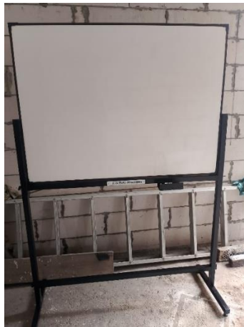
Gambar 6 Tampilan Pasang Papan Informasi

Selain itu, papan informasi dari besi memiliki stabilitas dan kekuatan yang lebih baik, yang membuatnya ideal untuk digunakan di area publik yang ramai atau di lokasi-lokasi yang rentan terhadap vandalisme.