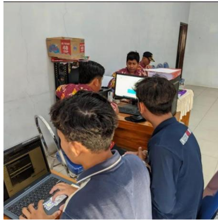
Gambar 1 Proses Pengerjaan Website

Lebih dari sekadar alat administrasi, website ini berfungsi sebagai sarana promosi yang krusial untuk Desa Lajuk, yang masih belum dikenal luas, terutama di kota dan kabupaten Pasuruan. Dengan menyajikan berbagai elemen seperti beranda yang menampilkan artikel terkini, profil desa yang mendalam meliputi visi dan misi, sejarah, serta informasi geografi dan demografi, website ini memberikan gambaran menyeluruh tentang desa. Pendekatan ini tidak hanya memperkenalkan Desa Lajuk kepada publik tetapi juga menonjolkan potensi dan keunikan desa yang mungkin menarik bagi pengunjung atau calon penduduk.