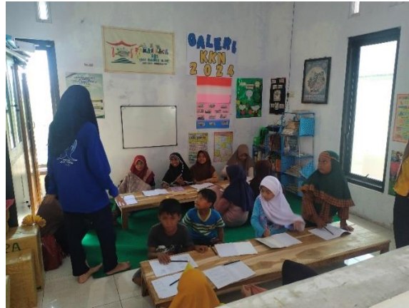
Gambar 11 Sukacita Bimbingan Belajar Antara Anak-Anak Desa dengan Mahasiswa KKN

Program ini tidak hanya berhasil memperbaiki fasilitas dan menambah dukungan belajar tetapi juga memperkuat komitmen masyarakat terhadap pendidikan anak-anak mereka. Hasil dari kolaborasi ini menunjukkan bahwa program ini dapat mengintegrasikan sumber daya dan keahlian lokal dengan inisiatif mahasiswa untuk menciptakan program pendidikan yang berkelanjutan, yang pada gilirannya berkontribusi pada masa depan yang lebih baik bagi Desa Lajuk.