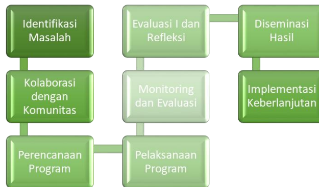
Diagram 1 Alur Metode CBPR

Setelah masalah diidentifikasi, tahap selanjutnya ialah merencanakan solusi secara kolaboratif. Dalam hal ini, mahasiswa KKN menawarkan beberapa solusi yaitu enam program kerja, seperti pembuatan website desa, pembibitan atau penghijauan di kantor kepala desa, penyediaan papan informasi dan bak sampah, kegiatan kerohanian, penggerakan pemuda-pemudi desa, serta pembentukan taman baca dan bimbingan belajar untuk anak-anak. Rencana ini harus disusun dengan mempertimbangkan masukan dari berbagai pihak di desa, sehingga solusi yang dihasilkan benar-benar sesuai dengan kebutuhan lokal.