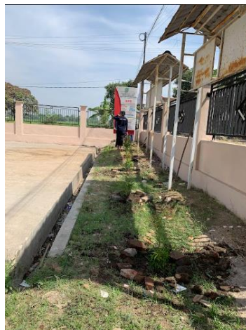
Gambar 5 Halaman Depan Balai Desa Setelah Penghijauan

Partisipasi yang tinggi dari masyarakat dalam program ini juga mencerminkan adanya peningkatan kesadaran akan pentingnya keterlibatan kolektif dalam menjaga lingkungan. Dampaknya, masyarakat tidak hanya melihat program ini sebagai proyek jangka pendek yang diinisiasi oleh pihak luar, melainkan sebagai tanggung jawab bersama yang harus diteruskan.