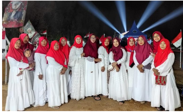
Gambar 14 Kerja Sama Ibu PKK dengan Mahasiswa KKN dalam Kegiatan Lajuk Bersholawat