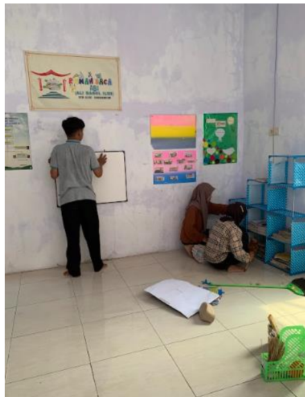
Gambar 10 Kegiatan Renovasi Taman Baca

poster ini dirancang untuk menambah pengetahuan dan mempermudah anak-anak dalam memahami materi yang mereka pelajari. Tidak hanya itu, mahasiswa KKN juga melakukan renovasi pada rak buku, yang kini lebih terorganisir untuk menyimpan buku bacaan anak-anak dengan lebih rapi. Dengan berbagai perbaikan ini, taman baca menjadi lebih fungsional dan menarik, mendukung proses belajar yang lebih menyenangkan dan efektif bagi anak-anak desa Lajuk.