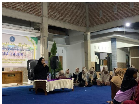
Gambar 9 Istighosah dan Ceramah Bersama Bu Nyai

Program ini merupakan program kerja kolaborasi yang erat antara mahasiswa KKN dengan ibu-ibu PKK dan ranting NU Desa Lajuk, sehingga kegiatan ini dapat berjalan dengan lancar dan mendapatkan dukungan penuh dari masyarakat. Kegiatan ini juga sangat efektif dalam membangun rasa memiliki terhadap program, di mana setiap elemen masyarakat berkontribusi sesuai dengan kapasitas dan peran mereka. Misalnya, ibu-ibu PKK berperan aktif dalam mempersiapkan acara istighosah dan pengumpulan dana untuk santunan, sementara ranting NU memberikan bimbingan spiritual dan dukungan moral. Tidak hanya itu, mahasiswa KKN juga turut terlibat aktif dalam kegiatan istighosah, membantu menyiapkan keperluan