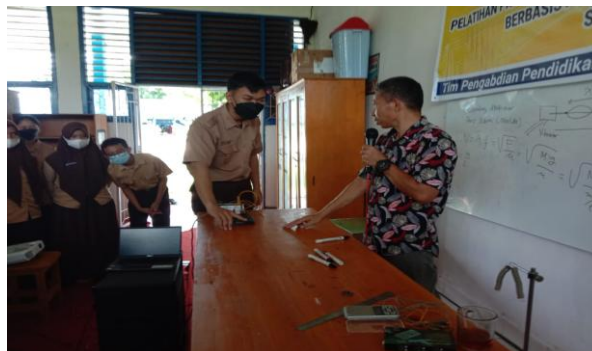
Gambar 3. Aktivitas Diskusi

Setelah pemberian materi dan simulasi kemudian dilakukan tanya jawab dan diskusi, kemudian dilanjutkan dengan latihan terkait materi yang disimulasikan.