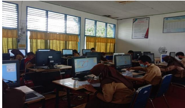
Gambar 4. Aktivitas saat Simulation PhET

Untuk mengetahui sejauh mana pemahaman peserta dengan simulasi yang disampaikan maka peserta pelatihan melakukan latihan soal. Berikut hasil kerja dari peserta.