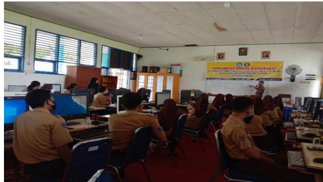
Gambar 1. Penyampaian Materi PhET simulations

Materi pembelajaran kimia dan fisika yang disimulasikan pada kegiatan pelatihan ini adalah build an atom dan rangkaian listrik DC, sehingga peserta dapat memilih materi sesuai dengan materi yang akan disimulasikan. Berikut tampilan awal PhET simulations