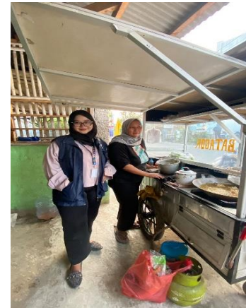
Gambar 1. Survei UMKM 1. Gambar 2. Survei UMKM 2. Gambar 3. Survei UMKM 3.

Tim KKN Universitas Pelita Bangsa terlebih dahulu melakukan survei lapangan di beberapa lokasi usaha yang ada di Desa Karangsetia. Survei ini dilakukan dengan cara mendatangi langsung tempat usaha milik warga, berdialog dengan pemilik usaha, serta mengamati aktivitas penjualan sehari-hari. Beberapa usaha yang dikunjungi antara lain warung makan, penjual seblak, usaha pempek, depot air minum, hingga toko kelontong. Kegiatan survei ini bertujuan untuk memperoleh gambaran nyata mengenai kondisi UMKM, mengidentifikasi kendala yang dihadapi, serta mengumpulkan data awal terkait legalitas usaha, media promosi, dan penggunaan sistem pembayaran digital. Hasil survei kemudian menjadi dasar dalam menentukan bentuk pendampingan yang sesuai, seperti pendaftaran NIB, pembuatan branding, pendaftaran Google Maps, hingga penerapan QRIS.