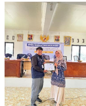
Gambar 4. Sosialisasi UMKM 1. Gambar 5. Sosialisasi UMKM 2. Gambar 6. Sosialisasi UMKM 3.

Setelah melaksanakan survei di beberapa lokasi usaha, Tim KKN Universitas Pelita Bangsa juga mengadakan sosialisasi terkait digitalisasi UMKM bagi para pelaku usaha di Desa Karangsetia. Sosialisasi ini bertujuan untuk memberikan pemahaman mengenai pentingnya pemanfaatan teknologi digital dalam mendukung pengembangan usaha, khususnya dalam