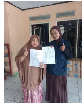
Gambar 7. Pembuatan NIB 1.