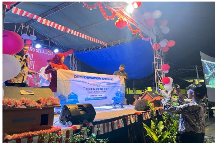
Gambar 16. Penyerahan Banner UMKM.

Dengan adanya pendaftaran lokasi usaha di Google Maps, para pelaku UMKM merasa terbantu karena usaha mereka kini dapat dijangkau oleh konsumen melalui pencarian digital. Hal ini diharapkan dapat meningkatkan jumlah pelanggan, memperluas jangkauan pasar, serta memberikan citra usaha yang lebih profesional di mata masyarakat.