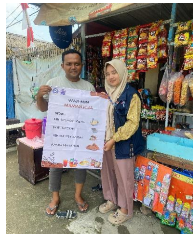
Gambar 19. Penyerahan Banner UMKM 3.

Sebagai pelengkap dari kegiatan pendampingan, Tim KKN Universitas Pelita Bangsa juga berhasil membantu pembuatan banner usaha bagi beberapa pelaku UMKM di Desa Karangsetia. Banner dirancang dengan menampilkan nama usaha, logo, daftar menu, serta kontak yang dapat dihubungi, sehingga dapat digunakan sebagai media promosi sederhana namun efektif. Dengan adanya banner ini, para pelaku UMKM merasa lebih percaya diri karena