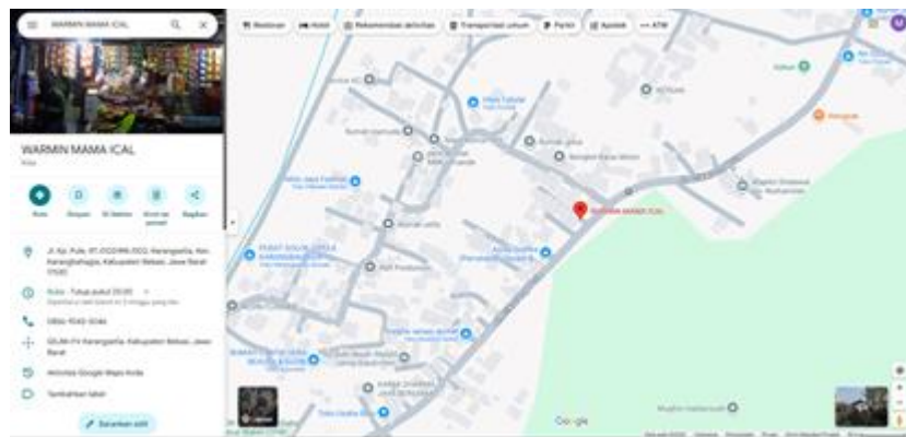
Gambar 14. Pembuatan Lokasi Usaha di Google Maps.