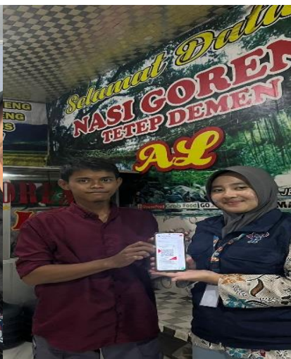
Gambar 11. Pembuatan Qris 2.