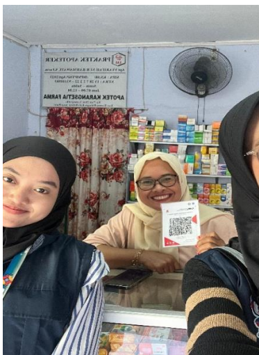
Gambar 10. Pembuatan Qris 1.

Namun, dalam proses pembuatan NIB juga ditemukan beberapa kendala yang dihadapi oleh pelaku UMKM. Salah satunya adalah kasus NIK yang sudah terdaftar di sistem OSS, meskipun pemilik usaha merasa belum pernah melakukan pendaftaran sebelumnya. Kondisi ini menyebabkan proses penerbitan sertifikat NIB menjadi terhambat. Selain itu, terdapat pula pelaku UMKM yang kurang teliti dalam menyiapkan dokumen persyaratan, sehingga perlu dilakukan pendampingan ulang. Kendala-kendala tersebut menunjukkan bahwa meskipun sistem OSS telah memberikan kemudahan, masih dibutuhkan peran pendampingan intensif agar pelaku UMKM benar-benar dapat memahami dan menyelesaikan proses legalitas usaha mereka secara mandiri di kemudian hari.