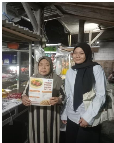
Gambar 18. Penyerahan Banner UMKM 2.