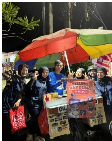
Gambar 17. Penyerahan Banner UMKM 1.