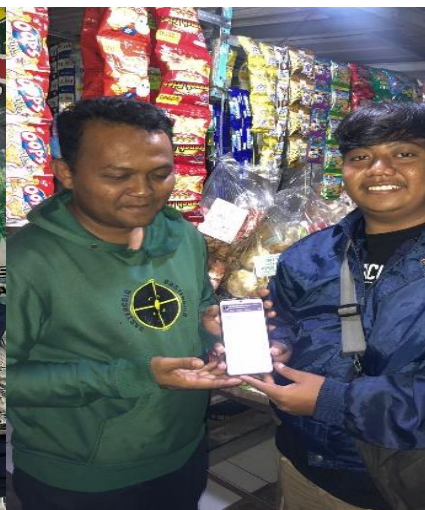
Gambar 12. Pembuatan Qris 3.

Setelah sukses dalam pendampingan pembuatan NIB, Tim KKN Universitas Pelita Bangsa juga melaksanakan program digitalisasi keuangan melalui penerapan QRIS bagi pelaku UMKM. Pendampingan dilakukan dengan membantu proses pendaftaran akun QRIS melalui mitra perbankan serta memberikan penjelasan mengenai cara penggunaannya. Beberapa UMKM yang menjadi sasaran berhasil memperoleh QRIS dan dapat langsung menggunakannya untuk transaksi sehari-hari.