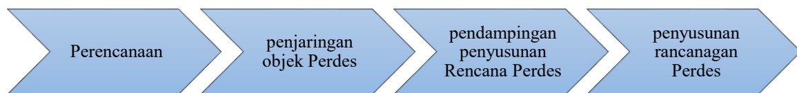
Gambar 1. Alur Pelaksanaan Pendampingan