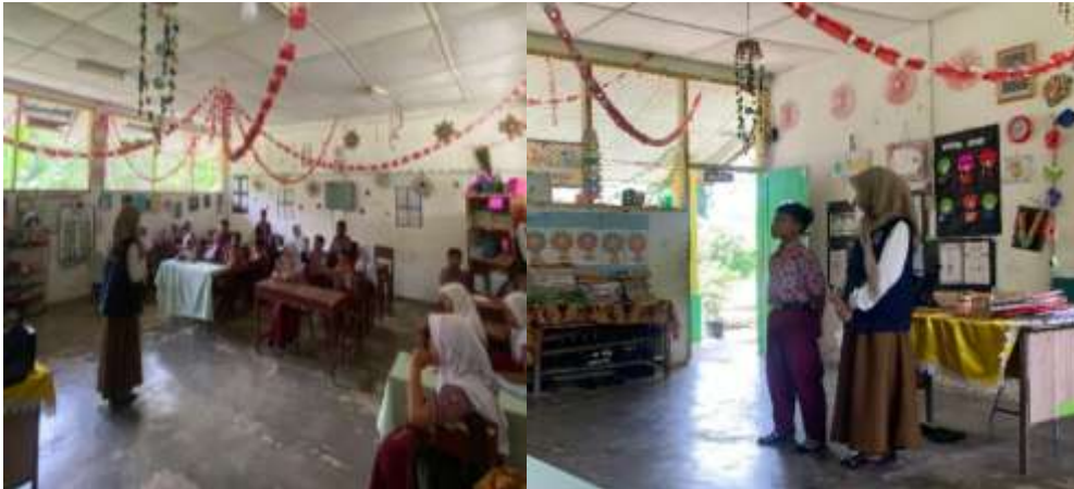
Gambar 2. Edukasi Anti Riba.