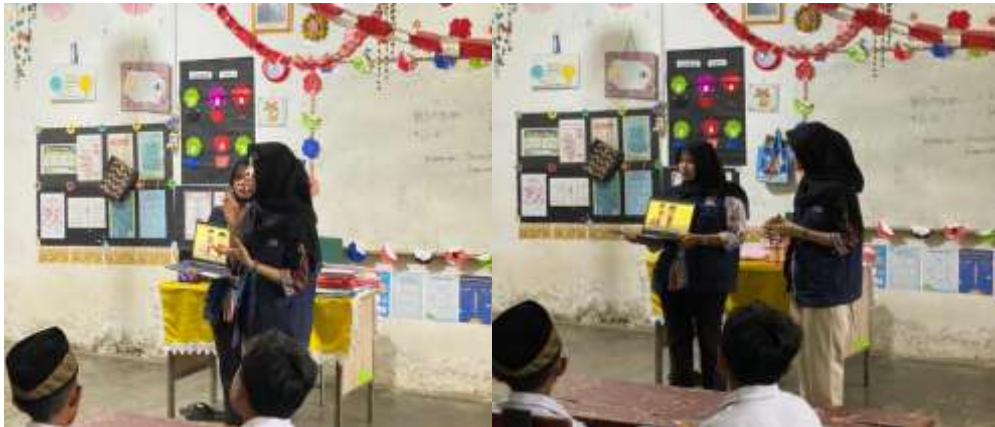
Gambar 3. Edukasi Gerakan Menabung Sejak Dini.