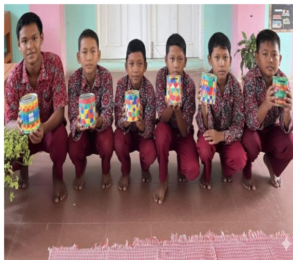
Gambar 2. Hasil Karya Celengan Target Siswa Kelas 6 SD 014662.