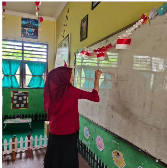
Gambar 1. Pemaparan Materi.

Keberhasilan program ini sangat bergantung pada konsistensi dan kerja sama antara sekolah dan rumah. Bimbingan orang tua yang aktif serta adanya program menabung di sekolah merupakan faktor penting dalam membentuk kemandirian keuangan anak kelak. Membiasakan anak menabung sejak kecil membantu memahami nilai-nilai seperti disiplin dan kemampuan menunda kepuasan, yang penting dalam menghadapi tantangan ekonomi, terutama bagi generasi Z yang rentan terhadap budaya konsumtif (Asharie, 2023; Indriani & Hadiyati, 2020). Dengan demikian, sosialisasi menabung tidak hanya sekadar pengajaran, tetapi juga merupakan investasi untuk membangun karakter anak agar lebih bijak secara finansial.