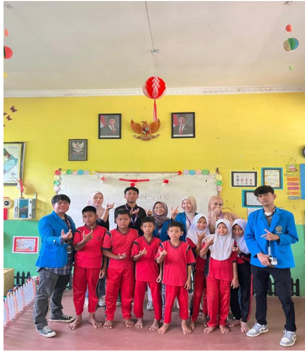
Gambar 3. Photo Bersama Siswa SD 014662.