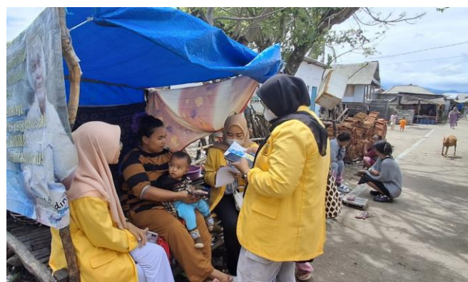
Gambar 3. Penyuluhan Pencegahan dan penurunan stunting di Masyarakat

Kegiatan yang berlangsung selama 19 hari ini mendapatkan respon positif dari Masyarakat, yang walaupun mereka mengaku sudah pernah mendapatkan penyuluhan dari dinas terkait, namun mereka merasa tetap perlu dilakukan penyuluhan. Menurut salah satu warga yang sekaligus kader posyandu di Desa Labuhan bajo tersebut bahwa, penyuluhan tentang pencegahan stunting harus terus dilakukan, karena menurutnya sebagian Masyarakat masih membandel khususnya yang berkaitan dengan gizi seimbang pada anak. Dengan alasan lelah karena pekerjaan, banyak orangtua yang tidak memperhatikan kebutuhan gizi anaknya, sehingga sehari-hari hanya sekedar memberikan uang jajan untuk anaknya kemudian membeli snack-snack yang tidak sehat ketimbang membuat atau memasak makanan yang baik untuk gizi anaknya. Menimbang kondisi tersebut, selanjutnya direncanakan akan dilakukan pengabdian Masyarakat yang berkaitan dengan gizi seimbang pada anak.