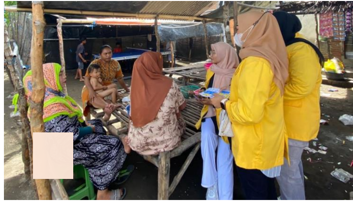
Gambar 2. Penyuluhan Pencegahan dan penurunan stunting di Masyarakat dengan anggota keluarga stunting

Kegiatan yang berlangsung selama 19 hari ini mendapatkan respon positif dari Masyarakat, yang walaupun mereka mengaku sudah pernah mendapatkan penyuluhan dari dinas terkait, namun mereka merasa tetap perlu dilakukan penyuluhan. Menurut salah satu warga yang sekaligus kader posyandu di Desa Labuhan bajo tersebut bahwa, penyuluhan tentang pencegahan stunting harus terus dilakukan, karena menurutnya sebagian Masyarakat masih membandel khususnya yang berkaitan dengan gizi seimbang pada anak. Dengan alasan lelah karena pekerjaan, banyak orangtua yang tidak memperhatikan kebutuhan gizi anaknya, sehingga sehari-hari hanya sekedar memberikan uang jajan untuk anaknya kemudian membeli snack-snack yang tidak sehat ketimbang membuat atau memasak makanan yang baik untuk gizi anaknya. Menimbang kondisi tersebut, selanjutnya direncanakan akan dilakukan pengabdian Masyarakat yang berkaitan dengan gizi seimbang pada anak.