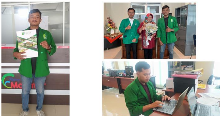
Gambar 1. Dokumentasi Kegiatan Pengabdian

Dinas Pemuda dan Olahraga melakukan pengawasan dan evaluasi terhadap pelaksanaan tugas-tugas lingkup kepemudaan dan olahraga untuk meningkatkan kualitas program yang diselenggarakan.