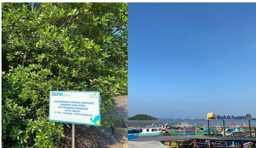
Gambar 2,3. serta melestarikan ekosistem mangrove yang ada di wisata Cuku Nyi-Nyi

Pengelolaan Ekowisata Cuku Nyi-Nyi yang ada di Desa Sidodadi dikelola oleh masyarakat sekitar, Pemerintahan Daerah dengan dibantu oleh binaan dari pihak PT Bukit Asam Peltar, PT PLN (Persero) UIP3B Sumatera dan LANAL. Semua pihak memiliki peran yang sangat besar dalam menjaga serta melestarikan ekosistem mangrove yang ada di wisata Cuku Nyi-Nyi. Hal ini berdasarkan wawancara yang diperoleh dari informan pengelola wisata Cuku Nyi-Nyi “Bahwa pihak luar yang memberikan kontribusi itu banyak namun yang selalu konsisten yaitu dari pihak Bukit Asam”.