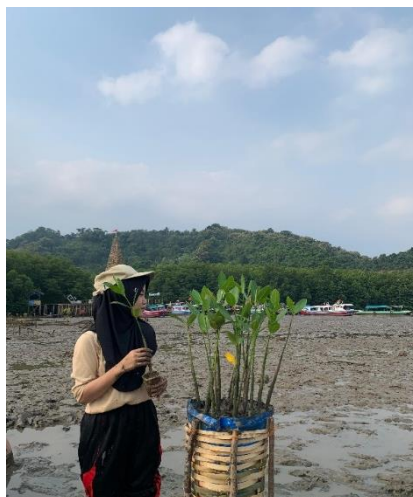
Gambar 1. tanaman mangrove yang ada di ekosistem hutan Sidodadi

Berdasarkan hasil wawancara dengan pengelola ekowisata di cuku nyi-nyi, ketiga spesies ini dibudidayakan karena mudah didapat dari hutan bakau sekitar dan mudah dibudidayakan.