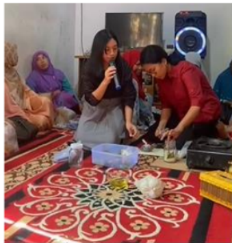
Gambar 2. Proses pembuatan lilin aromaterapi

Kegiatan pengabdian masyarakat yang dilakukan di Desa Sungai Majo Pusako melalui sosialisasi dan pelatihan pemanfaatan tanaman herbal sebagai bahan dasar lilin aromaterapi telah memberikan dampak nyata bagi peserta. Para ibu-ibu peserta pelatihan berhasil mempraktikkan pembuatan lilin aromaterapi dengan memanfaatkan tanaman herbal yang sebelumnya kurang dimanfaatkan. Melalui inisiatif ini, tanaman herbal yang dulunya jarang dimanfaatkan kini dapat diproses menjadi hasil produksi kreatif yang bernilai ekonomis. Produk-produk ini tidak hanya memperkaya keterampilan masyarakat tetapi juga membuka peluang usaha baru yang dapat meningkatkan perekonomian lokal.