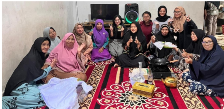
Gambar 4. Foto bersama setelah sosialisasi pembuatan lilin aromaterapi

Setelah program pengabdian masyarakat dilakukan, Langkah berikutnya ialah mengevaluasi kegiatan tersebut untuk menilai tingkat keberhasilan kegiatan ini. Keberhasilan tujuan kegiatan dinilai positif. Ibu-ibu partisipan kegiatan mampu membuat lilin aromaterapi dengan tepat dan benar, lebih mengerti dan paham tentang penggunaan tanaman herbal dalam pembuatan lilin yang ekologis dibandingkan dengan tidak memanfaatkan potensi alam sekitar (Simanjuntak et al. , 2024). Ibu-ibu peserta kegiatan juga dapat memahami manfaat dari tanaman herbal tersebut dan yang tidak kalah pentingnya, hasil lilin aromaterapi ini berpotensi meningkatkan wawasan masyarakat dalam kewirausahawan dan mendorong mereka untuk berinovasi dan berpikir kreatif dalam mengembangkan variasi produk lilin aromaterapi berbasis tanaman herbal (Safitriana et al. , 2023).