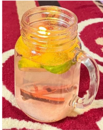
Gambar 3. Lilin aromaterapi

Setelah program pengabdian masyarakat dilakukan, Langkah berikutnya ialah mengevaluasi kegiatan tersebut untuk menilai tingkat keberhasilan kegiatan ini. Keberhasilan tujuan kegiatan dinilai positif. Ibu-ibu partisipan kegiatan mampu membuat lilin aromaterapi dengan tepat dan benar, lebih mengerti dan paham tentang penggunaan tanaman herbal dalam pembuatan lilin yang ekologis dibandingkan dengan tidak memanfaatkan potensi alam sekitar (Simanjuntak et al. , 2024). Ibu-ibu peserta kegiatan juga dapat memahami manfaat dari tanaman herbal tersebut dan yang tidak kalah pentingnya, hasil lilin aromaterapi ini berpotensi meningkatkan wawasan masyarakat dalam kewirausahawan dan mendorong mereka untuk berinovasi dan berpikir kreatif dalam mengembangkan variasi produk lilin aromaterapi berbasis tanaman herbal (Safitriana et al. , 2023).