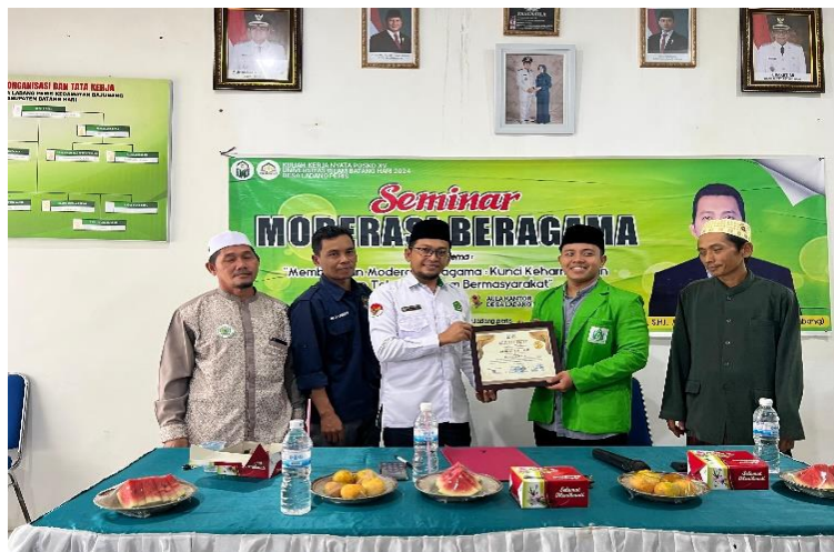
Gambar 9. Pemberian Sertifikat kepada Narasumber oleh Ketua Posko XV

Kegiatan seminar mengenai moderasi beragama ini dipandang penting dan perlu untuk dilakukan secara berkelanjutan. Secara keseluruhan, kegiatan pengabdian masyarakat berupa seminar moderasi beragama di Desa Lasdang Peris, Kecamatan Bajubang, Kabupaten Batang Hari ini memberikan sudut pandang baru dan komprehensif pada hadirin, di Balai Desa Ladang Peris tentang moderasi beragama. Antusiasme peserta terlihat ketika narasumber memaparkan materi terkait moderasi beragama ini.