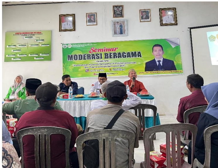
Gambar 3. Sambutan Sekdes Ladang Peris

Kegiatan seminar dimulai dengan acara pembukaan yang dipandu oleh Master of Ceremony (MC). Selanjutnya, acara dilanjutkan dengan Pembacaan Ummul Kitab lalu menyanyikan lagu kebangsaan Indonesia Raya, dilanjut dengan sambutan-sambutan. Sambutan pertama disampaikan oleh Ketua Posko XV KKN UNISBA, kemudian kata sambutan dari Sekretaris Desa yang menjadi perwakilan Kepala Desa Ladang Peris sekaligus membuka acara Seminar Moderasi Beragama di Desa Ladang Peris.