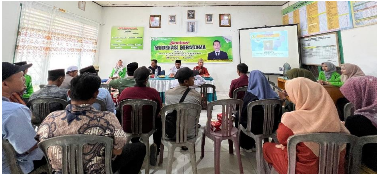
Gambar 5. Penyampaian Materi oleh Narasumber