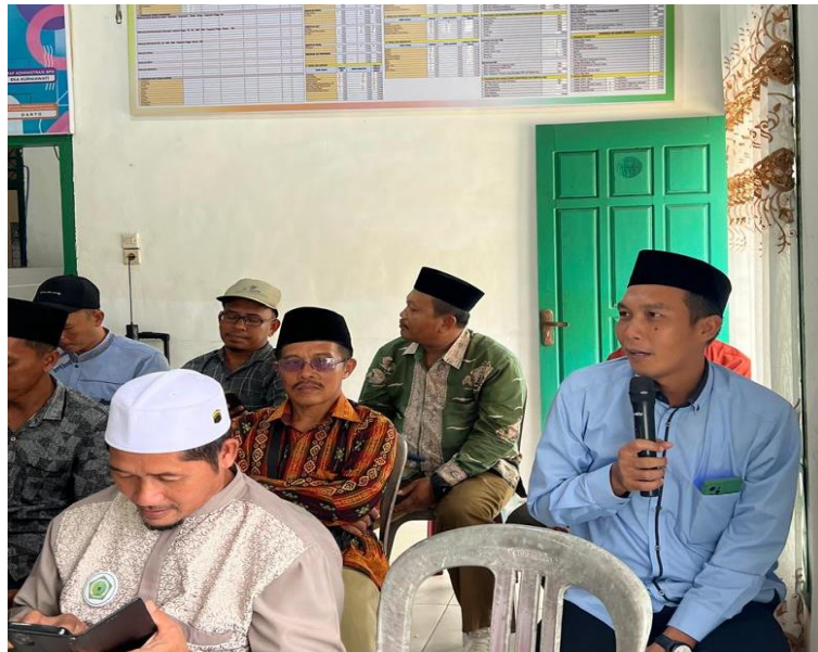
Gambar 6. Penyampaian Pertanyaan oleh Peserta