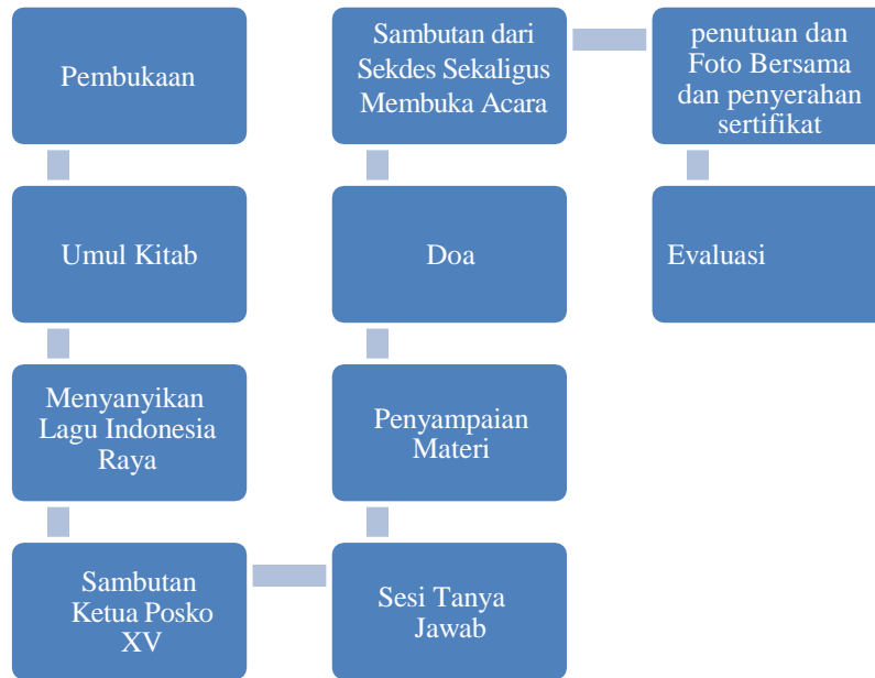
Gambar 2. Alur Kegiatan Seminar Moderasi Beragama

Kegiatan seminar dimulai dengan acara pembukaan yang dipandu oleh Master of Ceremony (MC). Selanjutnya, acara dilanjutkan dengan Pembacaan Ummul Kitab lalu menyanyikan lagu kebangsaan Indonesia Raya, dilanjut dengan sambutan-sambutan. Sambutan pertama disampaikan oleh Ketua Posko XV KKN UNISBA, kemudian kata sambutan dari Sekretaris Desa yang menjadi perwakilan Kepala Desa Ladang Peris sekaligus membuka acara Seminar Moderasi Beragama di Desa Ladang Peris.