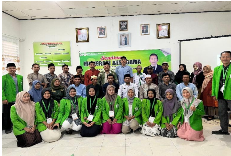
Gambar 8. Foto Bersama Seluruh Panitia Seminar Moderasi Beragam