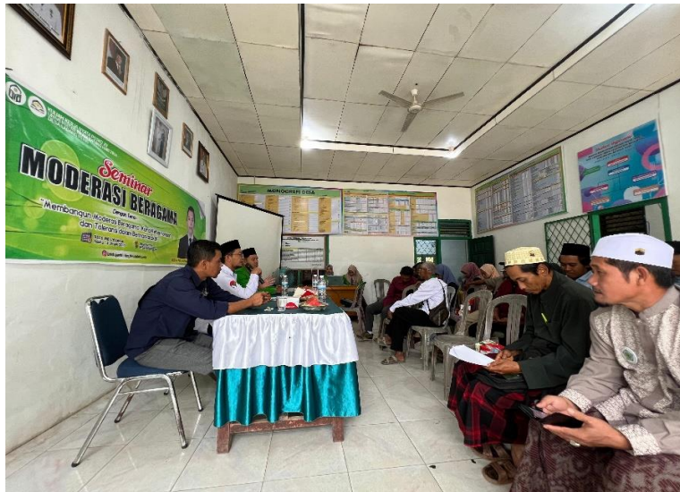
Gambar 4. Materi Seminar Moderasi