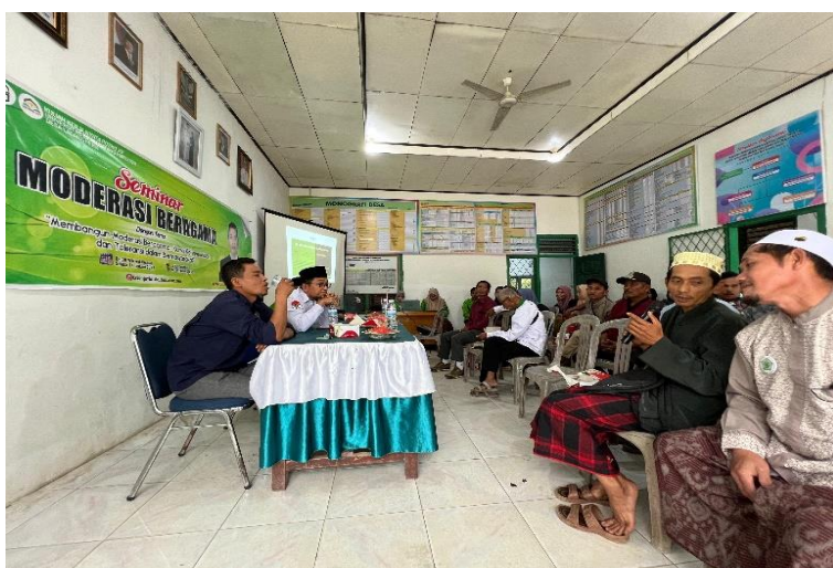
Gambar 7. Penyampaian Tambahan Jawaban oleh Da'i Desa Ladang Peris